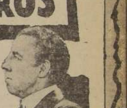
La creación artística más genial, más vigorosa y estupenda de: FERNANDO SOLER