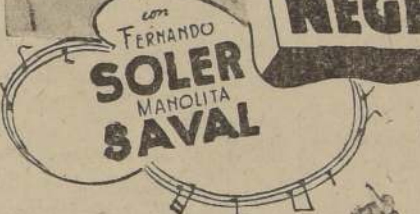
La creación artística más genial, más vigorosa y estupenda de: FERNANDO SOLER