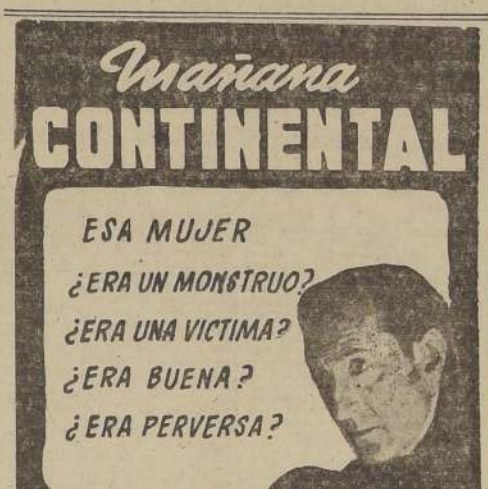
La creación artística más genial, más vigorosa y estupenda de: FERNANDO SOLER