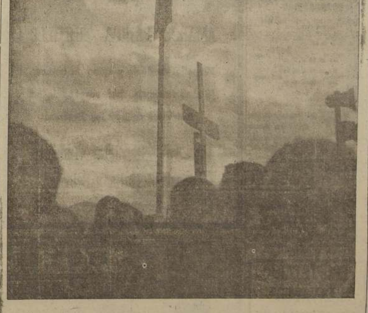
La insignia de la Patria flama junto al Símbolo de la Paz en los históricos Campos de Maipú.