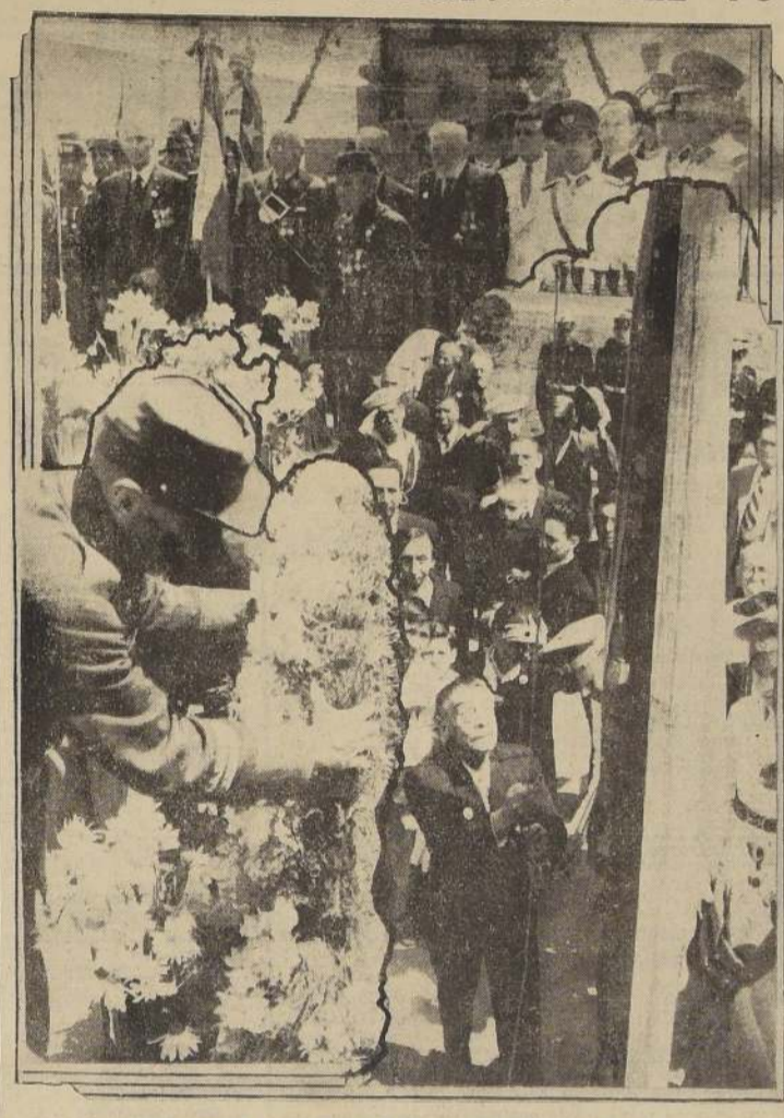
Durante la ceremonia realizada ayer en homenaje a los Veteranos del 79