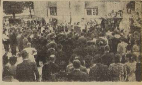
Parte de los asistentes a la concentración de los EE. Sanitarios

En la tarde de ayer se llevó a efecto en la Dirección de Sanidad una concentración de los empleados de ese Servicio, como una medida para que los salarios exigidos por los sanitarios, no fueran inferiores a los que perciben los empleados de otros servicios. La concentración se formó un desfile que recorrió varias calles de la ciudad hasta llegar al Palacio de la Moneda, para hacer entrega al Presidente de la República de un memorial en el que se exponen los problemas de los sanitarios y se pide que se intervenga en su favor.