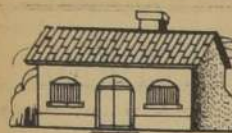
Casas y chalets en Providencia y Ñuñoa