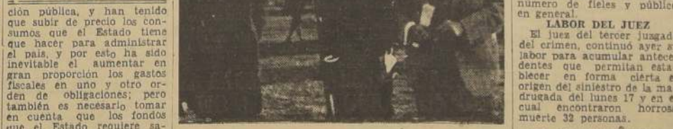
El Excmo. señor Alessandri, durante la visita que hizo ayer a la Exposición Canina