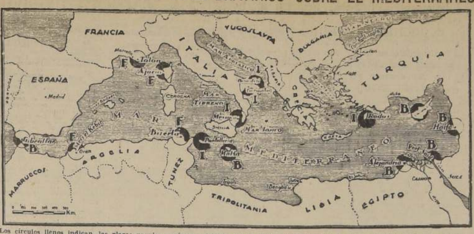
Los círculos llenos indican, las plazas navales o aéreas existentes en el Mar Mediterráneo; B, plazas británicas; P, francesas;

El acuerdo del Mediterráneo firmado últimamente entre los gobiernos de Gran Bretaña e Ita- lia, está muy lejos de haber con- tribuido a disminuir la tensión de relaciones diplomáticas que se originó entre ambos países al firmarse la guerra de Albania. Es que, por una parte, el tra- tado no es un "acuerdo de caballe- ros" como se lo ha llamado, y por otra, no resuelve ninguna de las fundamentales discrepancias que señalan a los Gobiernos de Lon- dres y de Roma al apreciar la cuestión del mar Mediterráneo.