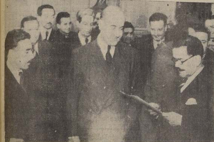
Durante la ceremonia del juramento de los nuevos Ministros de Estado.