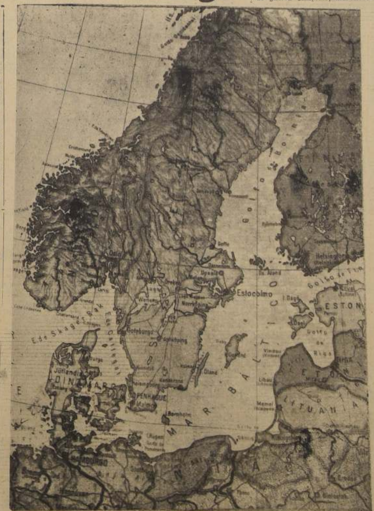
Con increíble rapidez las fuerzas del III Reich ocuparon ayer las capitales de Noruega y Dinamarca, así como la península danesa de Jutlandia y los puertos noruegos de Stavanger, Bergen, Trondheim y Narvik. Este último situado más allá del círculo polar ártico, tiene considerable importancia por ser el punto de embarque del hierro noruego destinado a Alemania.