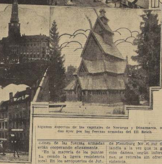
Algunos aspectos de las capitales de Noruega y Dinamarca, ocupadas ayer por las fuerzas armadas del III Reich

Gjedser, iniciando la marcha hacia el norte, y al mismo tiempo ocuparon el puente de Verdindborg en la parte sur de la isla de Zelândia.