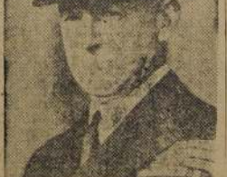
Almirante Sir Dudley A. Pound, Primer Lord del Almirantazgo británico.