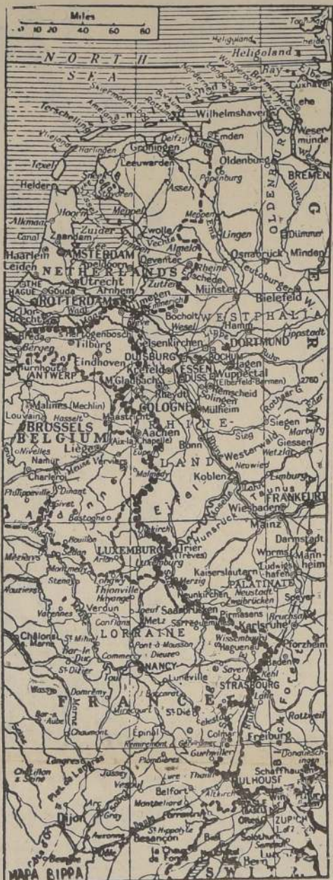
El frente occidental desde Holanda hasta las fronteras de Suiza

El diario del partido nazi, "Völkischer Beobachter", describió la actual lucha contra los rusos como que se desarrolla en "el más amplio campo de la capital del