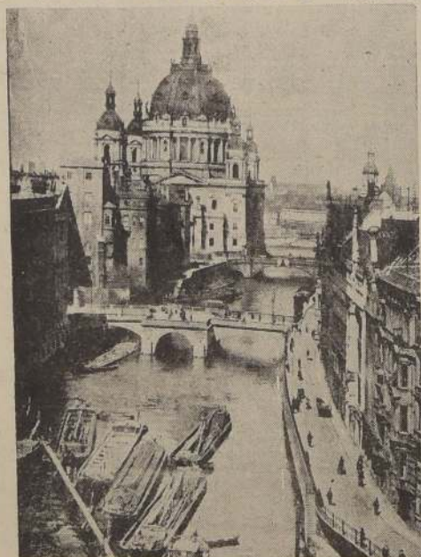
Berlín a orillas del Spree

Las mismas fuentes indican que la evacuación de localidades al