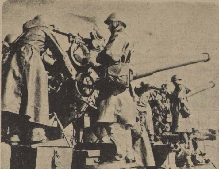
Las fuerzas rusas se aproximan rápidamente a la ciudad de Smela que se encuentra ya bajo el fuego de la artillería soviética de la cual vemos algunas piezas de una batería