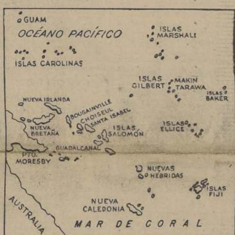
Mientras continúa el avance en Nueva Guinea, tropas del comandante del General Mac Arthur iniciaron la invasión de la isla de Nueva Bretaña en el archipiélago de Bismarck

FUERON ALCANZADOS LOS PRIMEROS OBJETIVOS SEÑALADOS POR EL PLAN