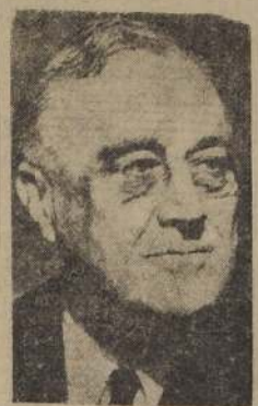
Mr. F. D. Roosevelt

WASHINGTON, 16. — (U. P.). — El Presidente Mr. Franklin D. Roosevelt se encuentra "a salvo" de regreso en Estados Unidos" según anuncio oficial de la Casa Blanca, el que no especifica sin embargo, cuando estará de vuelta en Washington.