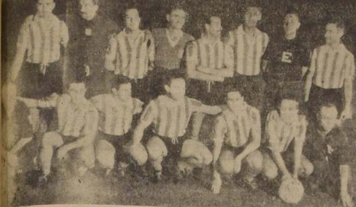
TRUÑO DE NUEVO.—El team del Racing Club, de Buenos Aires, que anoche obtuvo un nuevo triunfo, en cancha chilena, jugó mejor y mereció vencer a Rosario Central.