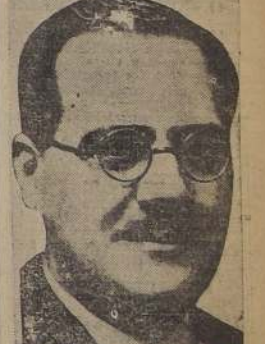
Negrín, que hizo prevalecer la voluntad de que continúe la lucha