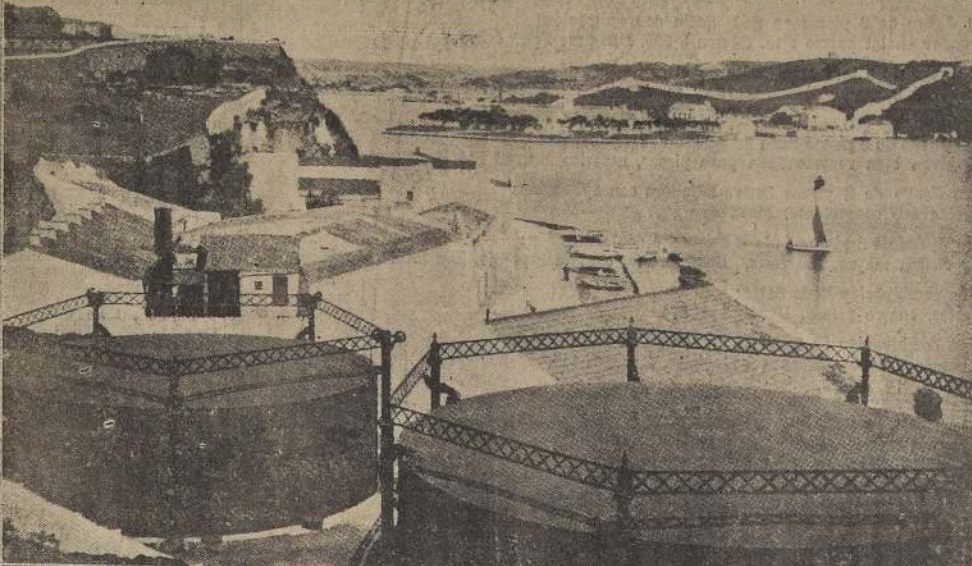
PARTE DEL PUERTO DE MA HON, en Menorca. El puerto es amplio, tiene mucho movimiento y allí es donde están las formidables baterías Vickers modernas de los republicanos