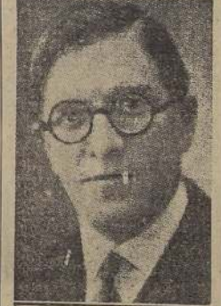
Alvarez del Vayo, que declara fracasadas las gestiones de paz

Francisco necesitará tiempo para expulsar a Cataluña y dar descanso a sus tropas, que han estado seis semanas en movimiento. Además, se dice que "fuentes nacionalistas" que Franco aún no está preparado para conquistar la zona central, por lo cual la gran ofensiva no comenzará sino dentro de varias semanas.