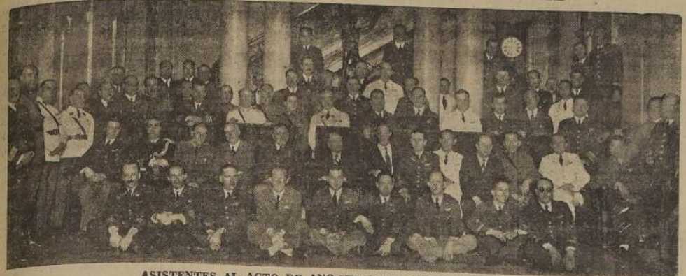
ASISTENTES AL ACTO DE ANOCHE EN EL CLUB MILITAR

PRESIDIO EL MINISTRO DE DEFENSA NACIONAL