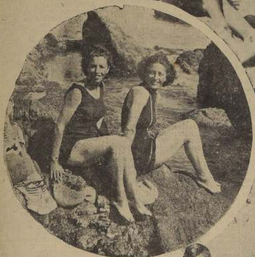
Aspecto que ofrecen las Playas del Bañero de Papudo a la hora del baño.