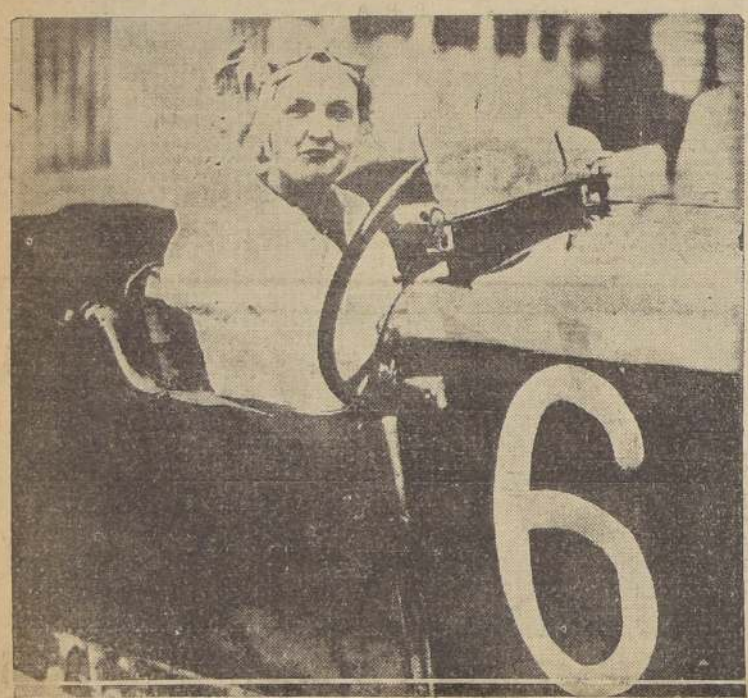
Una hermosa dama británica ha hecho de la carrera de automóviles una profesión como cualquiera otra, a pesar de los peligros que envuelve. Aquí la tenemos en su coche de turismo al cabo de una prueba reciente en Brooklands, Inglaterra, en la cual remató tercera.