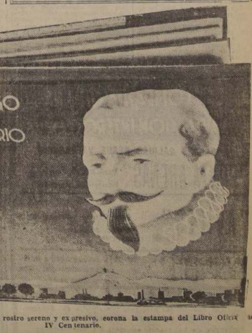
La venerable efigie de Valdivia, rostro sereno y expresivo, corona la estampa del Libro Oficial del IV Centenario.

que informa la vida moderna. No vacilaron cuando llegamos hasta ellos para proponerle la publicación de la obra, a fin de que el Municipio la autorizara oficialmente. Desde el primer instante