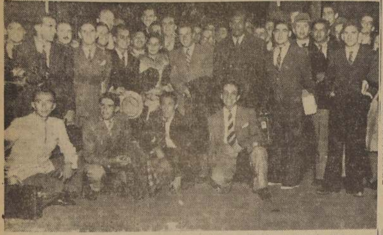
Los integrantes de la delegación peruana de basketball, a su llegada a la Estación del Norte.

Desde anteaño se encuentra en Santiago la delegación peruana de basketball del Perú, cuyos integrantes en los tres matches a jugar, se disputará el trofeo "Peru-Chile" que han constituido los