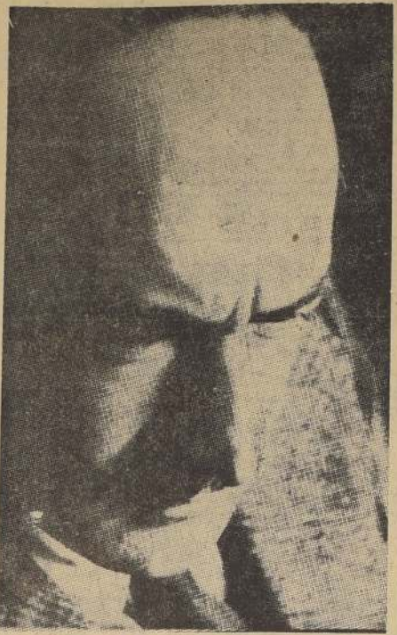
Así es la fisonomía de Salvatore Quasimodo, el refinado poeta italiano que, después de Pirandello, ha conquistado para su patria el Premio Nobel de Literatura.

El principal rival de Quasimodo en la elección de este año, según se supo, fue otro escritor italiano, el novelista Alberto Moravia.