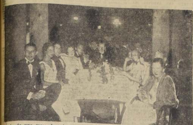
Aspecto de una mesa durante una de las últimas reuniones del Casino de V. del Mar.