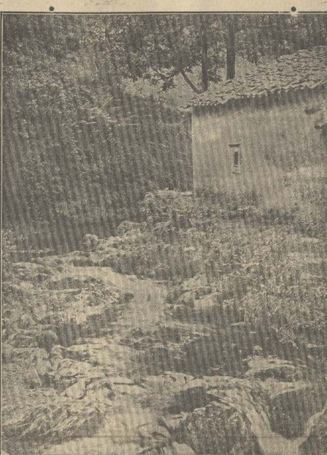
Ordilares (Asturias): Un arroyo