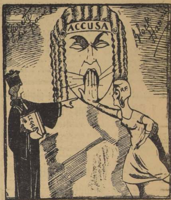
R. F.—;Basta! ;Evitemos un escándalo mayor!

LA VERDADERA JUSTICIA. —Por lo mismo, ¡retira la mano!