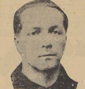
Guerrero ATLETISMO LA CARRERA INTERNA Y PASEO DEL ATLANTIDA

El cuadro del La Cruz visitante estará constituido en la siguiente forma: