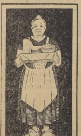
ACEITE MONTE CARLO ES EL MEJOR LOS ENVASES VACIOS SE CONVIERTEN EN BANDERA 684

CLUB CICLISTA CENTENARIO La junta general de este club se reunirá hoy a las 21.30 horas, en el local de la secretaría, San Francisco 264. Como hay importantes asuntos que resolver, los socios pueden recomendar la asistencia a los socios. Sección Basketball.—Esta sección practicará basketball en la cancha situada en el local social. DEPORTIVO VELOZ El Domingo se continuará desarrollando el campeonato interno del Club en el Circuito de Puente Alto. La partida estará en San Joaquín esq. de Santa Rosa y se iniciará a las 7 horas. En la tarde se verificará una excursión a Malpú, donde se servirá una onca.