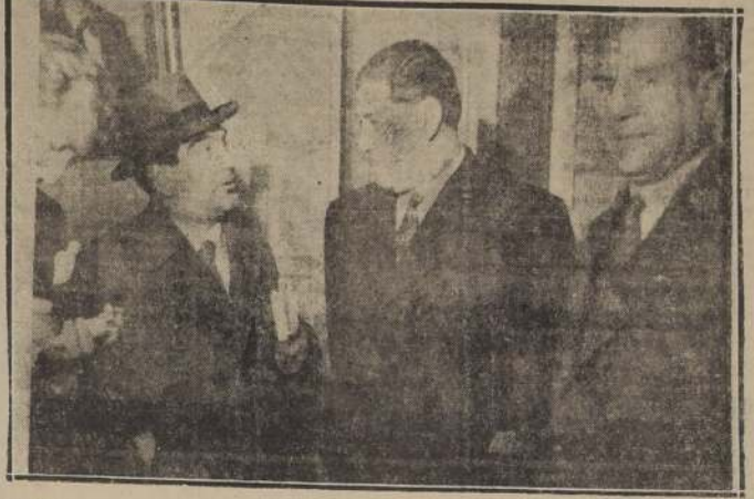
El Ministro del Interior, don Luis A. Cueva con los señores Brañes y Valenzuela, momentos después de haber renunciado a la presidencia del Partido

CITY DEL VATICANO, 16.— El Vaticano ha recibido una gran cantidad de artículos de viveres procedentes del Brasil, para ser distribuidos en las zonas de Roma.