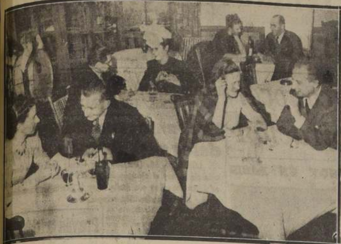
Aspecto del elegante comedor de la Hostería de Providencia, cuyo local se ve a diario prestigiado por una distinguida concurrencia.