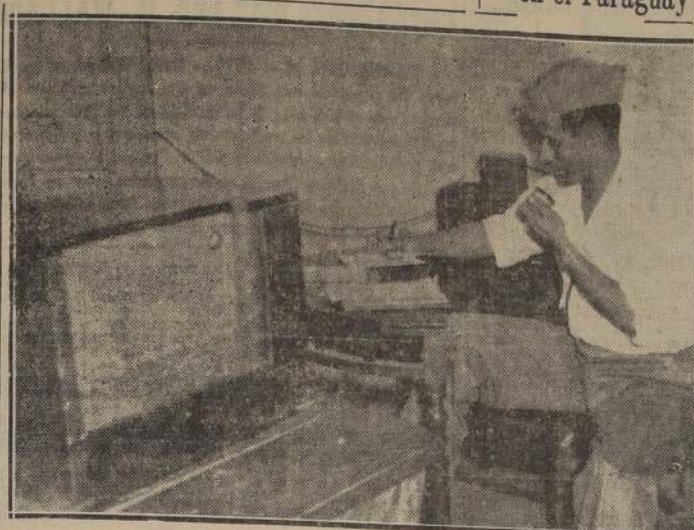
Un oficial del Estado Mayor de las fuerzas del Gobierno paraguayo transmite órdenes por radio a una patrulla destacada en una posición estratégica. (Foto ACME).

PARAGUAY, 16. — (U. P.). — Los revolucionarios paraguayos abandonaron ayer Pedro Juan Caballero, cuando se anunciaron las noticias de que los gobiernistas habían entrado a Sanga. Los revolucionarios se sorprendieron en la decisión, ya que la resolución de la guerra civil se había avanzado considerablemente en las últimas horas de la noche, cuando se había producido el abandono de Pedro Juan Caballero.