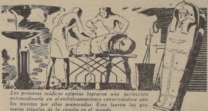
Los primeros médicos egipcios lograron una perfección extraordinaria en el embalsamamiento conservándose aún las momias por ellos preparadas. Esos fueron los primeros triunfos de la cirugía en el mundo.