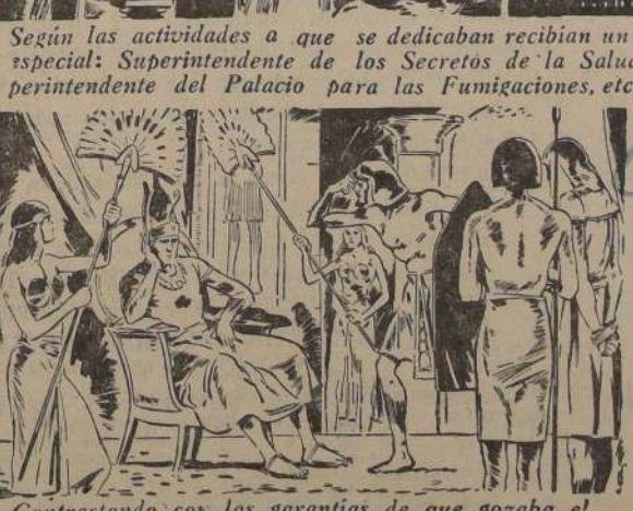
Según las actividades a que se dedicaban recibían un título especial: Superintendente de los Secretos de la Salud, Superintendente del Palacio para las Fumigaciones, etc.

Contrastando con las garantías de que gozaba el ejercicio de la medicina, estaban las disposiciones que permitían hasta la pena de muerte para aquellos médicos que hubiesen cometido errores graves.