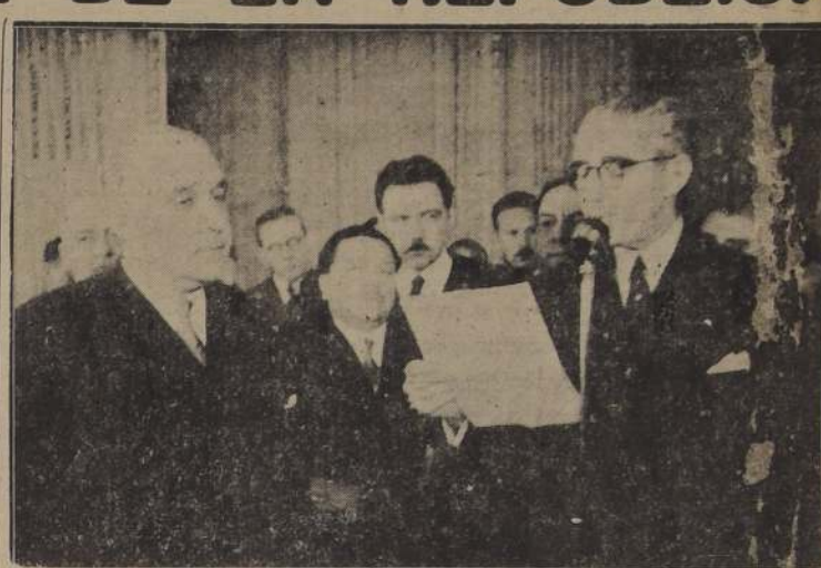
El Excmo. señor Ríos contesta el discurso pronunciado por el Excmo. señor Duhalde

Dijo, igualmente, que tomaría diez o quince días de descanso en su fundo de La Unión, y que durante su ausencia la subrogaría en el Interior el Canciller don Joaquín Fernández.