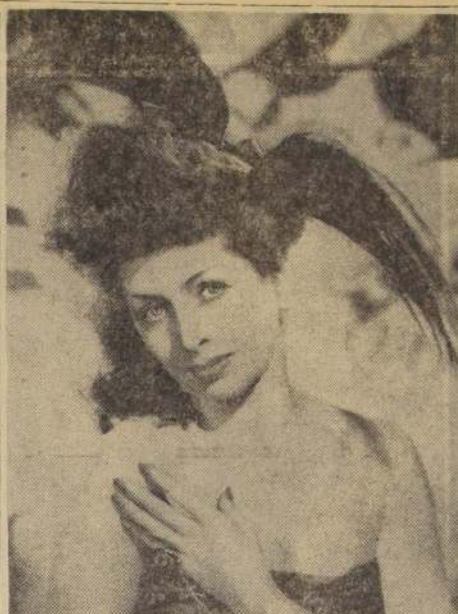
Rosita Serrano vuelve a la patria. A fines del presente mes volverá a Santiago, después de varios años de ausencia en Europa, la famosa cantante chilena Rosita Serrano, figura de gran importancia en nuestra música, que ha alcanzado las grabaciones de su voz y al éxito que obtuvo en la capital al presentarse en persona hace algún tiempo en el Teatro Municipal y luego en emisoras de la capital.

Según informes que nos han proporcionado personas de la empresa comercial que la ha contratado, Rosita viajará directamente de Londres a Santiago para actuar como atracción extraordinaria en un novedoso "show" que el Teatro Real agregará a sus programas cinematográficos. En lo que se refiere a actividades radiotelevisivas, también sabemos que Rosita Serrano cantará únicamente por Radio Corporación, estando ya suscrita el contrato para debutar a comienzos de octubre en la emisora del Banco del Estado.