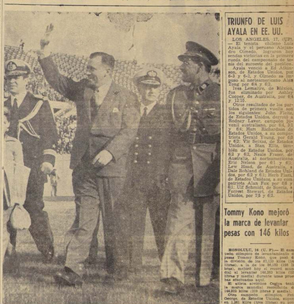
REALIZO LA REUNION. — Minutos antes de comenzar el match internacional, se hizo presente en el Estadio, S. E. el Presidente de la República del Paraguay, Excmo. señor General Alfredo Stroessner, quien fue acompañado por los Edecanes. Antes de iniciarse el match avanzó hasta el centro de la cancha, en un gesto muy cordial y democrático. Saludó a cada uno de los 22 jugadores y luego de dar el puntapié inicial, se acercó con la mano en alto hasta las esportaduras de la puerta de la maratón, donde fue objeto de una ovación por parte del público.