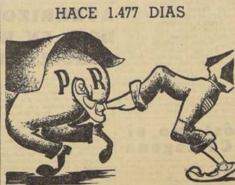
EL PUEBLO LOS ARROJO DEL PODER Y NO VOLVERAN.

En las poblaciones Preña y Balma, a las 17 y 18 horas, el Orfeón Santa Cecilia presentará retretas musicales. Finaliza el programa de hoy, con una retreta en la Plaza Yungay, por el Orfeón citado anteriormente, de 19 a 20 horas.