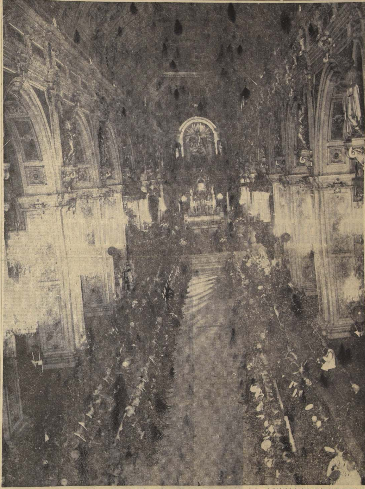
Aspecto imponente que ofrecía ayer la Catedral, durante el desfile del "Tédum Laudamus", celebrado en expresión de gracias y en conmemoración de la Primera Junta de Gobierno Nacional, instalada en