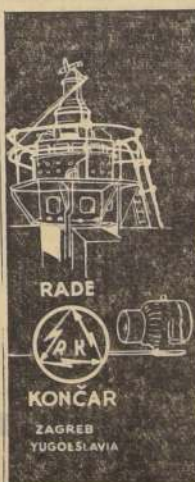
LA FABRICA RADE KONCAR TIENE 51 AÑOS DE EXISTENCIA 4.000 OBREROS 80.000 K.W. DE PRODUCCION ANUALES. GARANTIA: SIRVE A 17 NACIONES NORMAS: V. D. E. ALEMANAS.