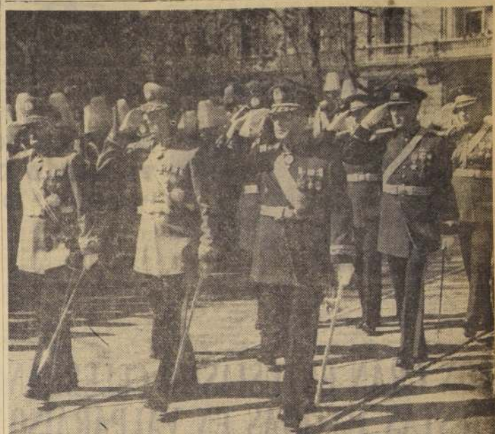
Las Fuerzas Armadas se hicieron representar ayer en el Teódum, con que se inició el Aniversario Patrio, por delegaciones integradas por sus más altos jefes. En el grabado, vemos a

Llevamos como fruto honorífico de esta visita, los Convenios firmados que permitirán el estrechamiento de nuestras relaciones, por medio del intercambio, que servirán a más de lo que constituyen como instrumentos que complementan nuestras economías de medios prácticos para establecer las corrientes permanentes del espíritu, y para asociar nuestros talentos de progreso, en los órdenes de la técnica y de las ciencias."