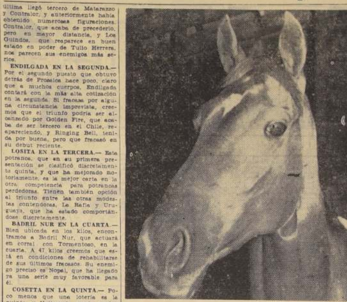
La hermosa cabeza de la veloz Nanai, que defenderá nuestro pronóstico en la interesante carrera de hoy en el Clásico "Carlos de Monery".

41. De Noche 54.1 42. E. Saavedra 54.1 43. E. Saavedra 54.1 44. E. Saavedra 54.1 45. E. Saavedra 54.1 46. E. Saavedra 54.1 47. E. Saavedra 54.1 48. E. Saavedra 54.1 49. E. Saavedra 54.1 50. E. Saavedra 54.1