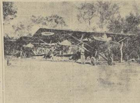
Aviones paraguayos antes de elevarse para comenzar el ataque