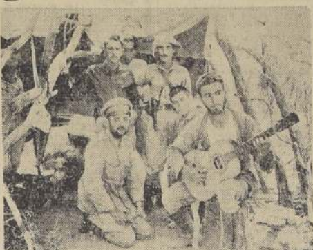
Grupo de oficiales paraguayos, en momentos de descanso

Buenos Aires, 27. — (U. P.).— Los mediadores en el conflicto del Chaco se reunieron extraoficialmente esta tarde en la residencia privada del Ministro de Relaciones Exteriores del Brasil, señor Macedo Soares, donde hicieron las once. A la reunión asistieron 4 Ministros de Relaciones Exteriores: señores Macedo Soares, Saavedra Lamas, de la Argentina, Elio, de Bolivia, y Ríart, del Paraguay, estos dos últimos separadamente, motivo por el cual no se han iniciado aún conversaciones directas entre los beligerantes. El Canciller paraguayo