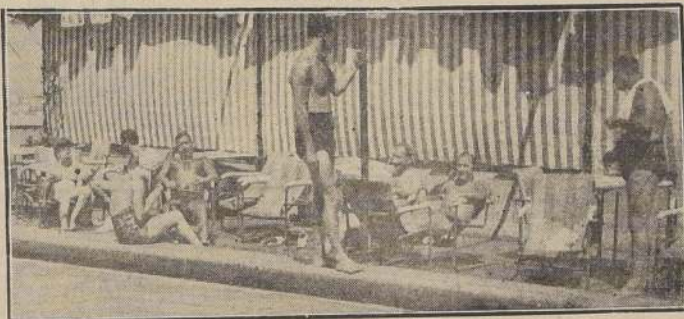
Aspecto parcial de la piscina ubicada en el 17.º piso del Hotel Carrera.