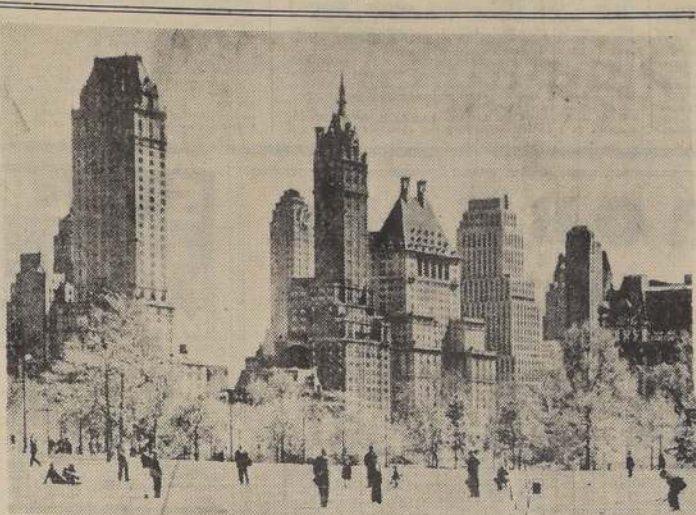
Rascacielos en el Parque Central de Nueva York.