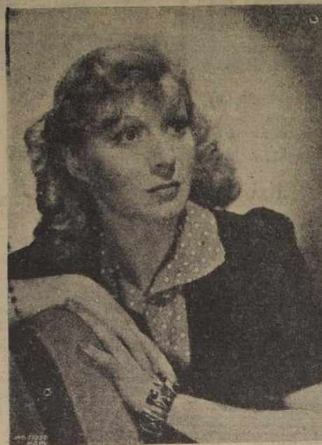
Geor Carson, la nueva estrella que, junto con Donal, protagonizan la película que estrena mañana el Metro

En las funciones de mañana, viernes y noche de mañana, el Teatro Metro estrenará la película "Adios, Mister Chips". Una adaptación de la famosa novela de James Hilton, el autor de "Horizontes perdidos". "Adios, Mister Chips" es el relato de una vida, de toda una vida. Ambiciones de juventud, ilusiones de amor, recuerdos del ayer, paz y quietud son las diferentes etapas por donde pasa "Chips", un tímido profesor inglés. Robert Donal, el intérprete de "Chips", su caracterización revive el personaje creado por Hilton en forma tan humana que parece, en realidad, un ser auténtico. Su estreno, mañana en el Teatro Metro, será la emoción del año que termina. "Adios, Mister Chips" se exhibirá, también, en la función de mañana, que se efectuará a las 12.30 de la noche de Año Nuevo.