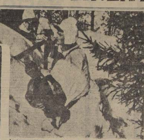
La tenaz y bien dirigida defensa de los finlandeses ha culminado con un victorioso contraataque en la región de Licksa—marcada con una flecha—en el curso del cual los defensores de Finlandia cruzaron la frontera y entraron a territorio ruso.

Se recuerda que este es el segundo violento temblor registrado en Turquía en las últimas semanas. Cuarenta y tres personas perecieron y muchas resultaron heridas, y 16 aldeas y caseríos fueron destruidos en el mes pasado a consecuencia de los violentos temblores que sacudieron a toda Anatolia con intermitencias durante 24 horas.