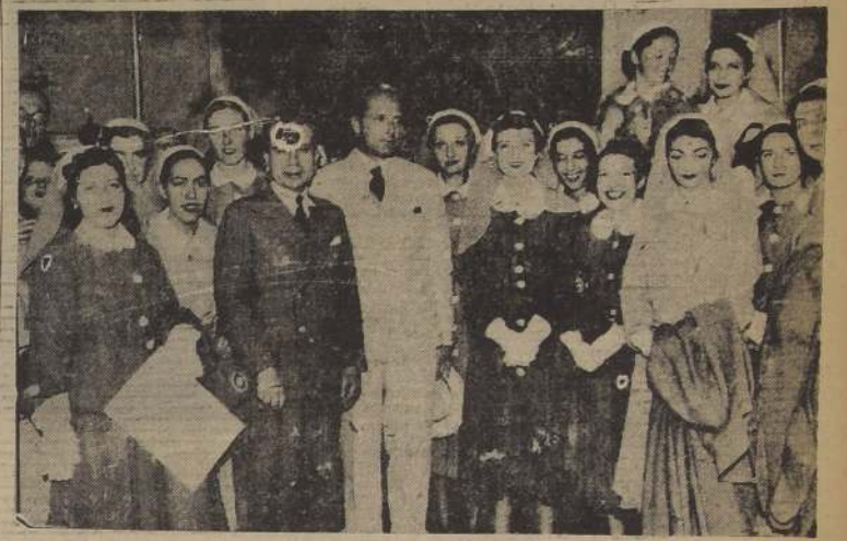
Durante la ceremonia de ayer en la Escuela de Servicio Social

En sencilla ceremonia efectuada a las 18.30 horas, en el local de la Es- cuela, a la que asistieron el Director de la Beneficencia y autorida- des educacionales, se les hizo entrega de sus respectivos diplomas