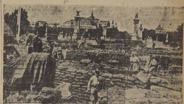
En la explanada de los Inválidos, de París, se inauguró una muestra de equipos para la defensa de esa capital, como lo muestra el grabado.