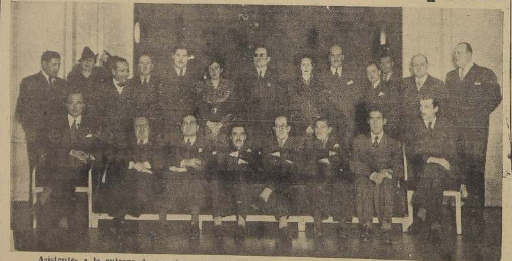
Asistentes a la entrega de premios en el concurso abierto por el Instituto de Información Campesina

A las 17.30 horas de ayer, se llevó a efecto en el Crillon de la ciudad la entrega de premios del concurso abierto por el Instituto de Información Campesina, con motivo de la entrega de los premios a los concursantes premiados en el certamen literario reciente, abierto por este organismo, a fin de que los escritores chilenos escriban para el campo y no sobre el campo.