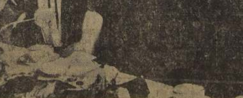
El ex rey Ahmed Zogü, su esposa la ex reina Geraldina, durante un almuerzo en la terraza de su hotel en Estambul. Allí pasan los días después de su rápida salida de Tirana antes de la entrada de los italianos, sus ex amigos

REALES FUGITIVOS EN SU DESTIERRO DE TURQUIA