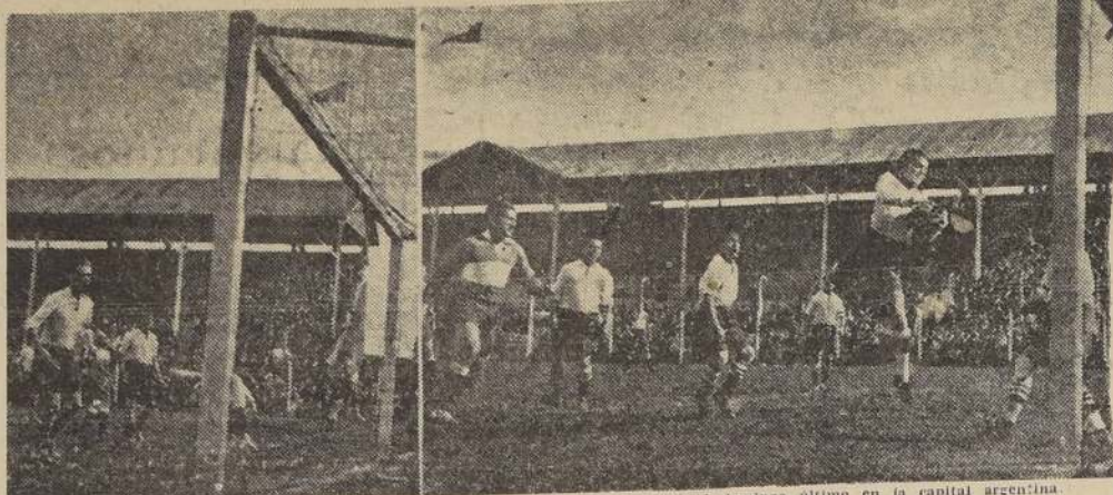
Dos escenas del encuentro de COLO COLO con RACING, partido que se jugó el domingo último en la capital argentina.

Han transcurrido más o menos, quince minutos. En este momento Guaya se escurre entre los defensas chilenos y abre el score. Dado que no ha tenido el tiempo necesario de buscar colocación en su valla. El entusiasmo de los visitantes