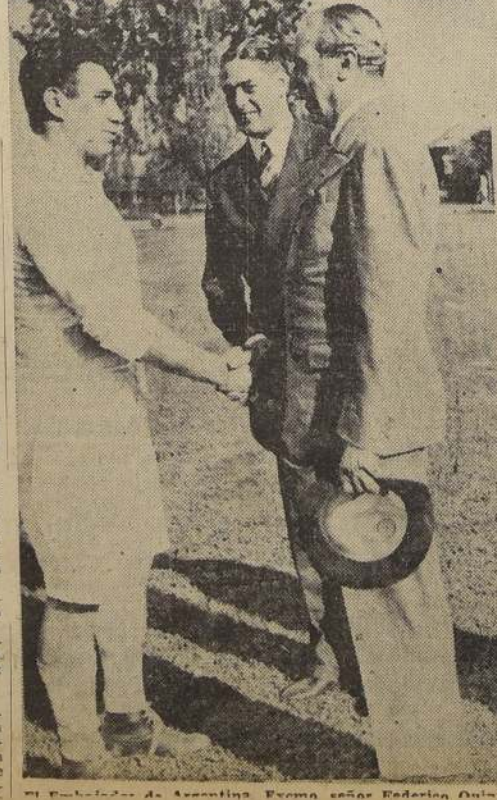
El campeonato de Argentina forma señor Federación Argentina de Basketball.

ELIMINATORIAS. Desde el martes próximo empezarán a disputarse los partidos de eliminación en las diferentes divisiones, los cuales reúnen un mayor interés, por tratarse de partidos que fijarán la clasificación de los equipos.