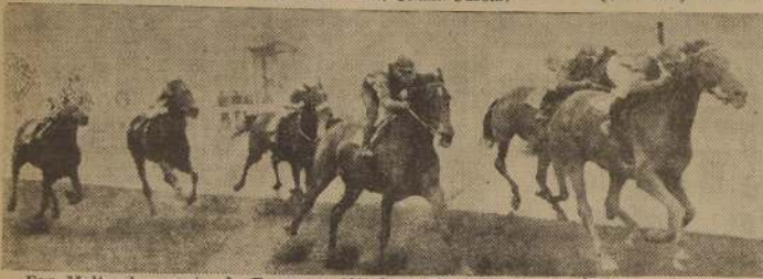
Far Molto da cuenta de Frescura, Alforja e Hija Rubia en la séptima.

RAPIDO (ALMODOVAR) Y GRAN SEÑOR (HEIDELBERG) PAGANDO ESTE $ 105.10 CON $ 5.00, EL MEJOR SPORT DE LA REUNION, SALIERON DE PERDEDORES. — CHALUPA, MALICO, MISSISSI PI, ($ 44.70); FAR MOLTO Y CUTE EYES ($ 54.20) SE ADJUDICARON LOS COMPROMISOS DE 1,200 METROS