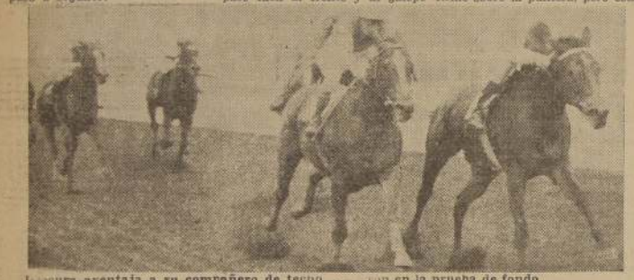
Procura aventaja a su compañero de techo en la prueba de fondo