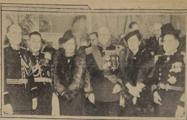
Los aspectos de la brillante recepción ofrecida ayer en la Moneda por S. E. el Presidente de la República y señora de Aguirre Cerda con motivo de la apertura del Congreso.