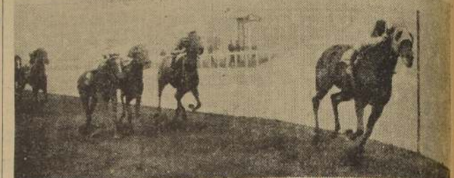
Mississippi al galope delante de Vodka, Oración y Lilian Harvey