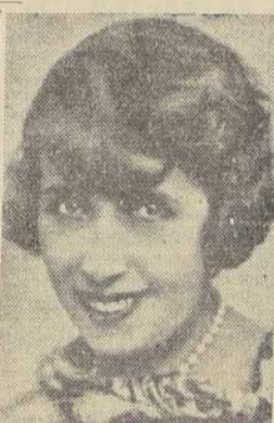
LA MISTINGUETT DICE:

"No os lavéis la cara con agua. Una vez por semana someted a vuestro cara a un baño de vapor por medio de paños calientes. Este método elimina los puntos negros y las impurezas del cutis; esto y aplicaciones de cremas, mantiene el rostro fresco, claro y atractivo."