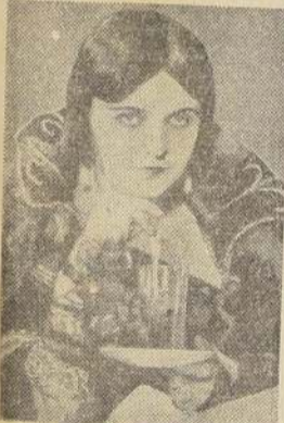
POLA NEGRI DICE:

Acuéstese temprano. No se recoja usted nunca tarde! El arte de mantenerse bella no debe llegar a molestar las diarias tareas. Ante todo déjenme insistir sobre el hecho