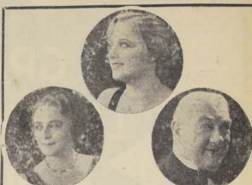
EL TRIO MAS ESCANDALOSO DE DOVILLE Si Ud. lo duda, véalos en

Pero aquí va la parte en contra: Anita Page, padre ingeniero; Nils Asther, fabricante de fósforos; Dorothy Sebastian, agente en propiedades; Charles Bickford, importador de café; Greta Garbo y Dorothy Jordan, comerciantes; la madre de Bessie Love era profesora de escuela.