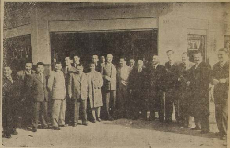
Parte de la numerosa concurrencia que asistió ayer a la inauguración del Primer Local de Ventas de la C. T. V.

CON ESTE MOTIVO SE OFRECIO UN COCKTAIL A REPRESENTANTES DEL COMERCIO Y NUMEROSOS INVITADOS