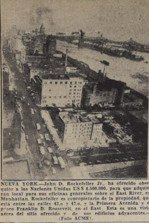
NUEVA YORK.—John D. Rockefeller Jr. ha ofrecido obsequiar a las Naciones Unidas US$ 8.500.000, para que adquieran local para sus oficinas generales sobre el East River, en Manhattan. Rockefeller es copropietario de la propiedad, que está entre las calles 42.ª y 47.ª, y la Primera Avenida y el paseo Franklin D. Roosevelt, en el East. Esta es una vista aérea del sitio ofrecido y de sus edificios adyacentes.