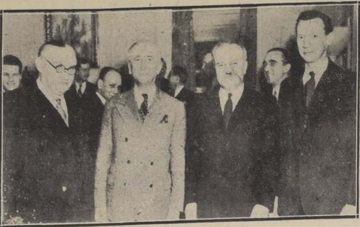
NUEVA YORK.—Los "Cuatro Grandes" posan para los fotógrafos en la reunión final de las Naciones Unidas celebrada el 12 del actual. Se reunirán nuevamente en Moscú en marzo de 1947. Son, de izquierda a derecha: Ernest Bevin, Gran Bretaña; James F. Byrnes, Estados Unidos; Molotov, de Rusia; y Maurice Couve de Murville, de Francia.