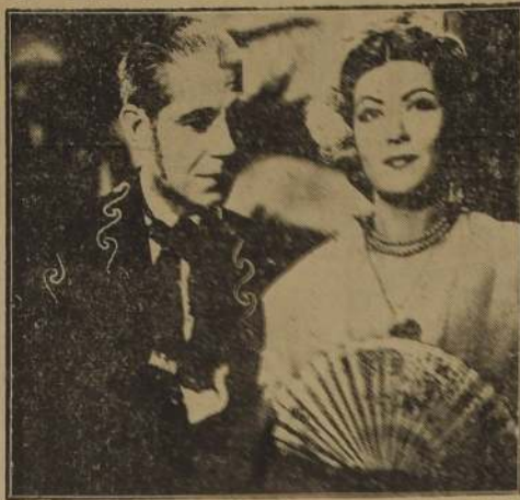
Andrés Soler y Gloria María, en una escena de "Alma de Bronce", que se estrena hoy en el Teatro Continental, distribuida por Artistas Unidos.

HOY SE ESTRENA "ALMA DE BRONCE" EN EL TEATRO CONTINENTAL