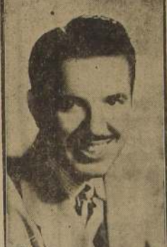
UNA ORQ. TIPICA EN RADIO LA AMERICANA

Como es del conocimiento público, todos los martes, jueves y sábados, Radio Sociedad Nacional de Minería está presentando un desfile de artistas en su salón auditorium.