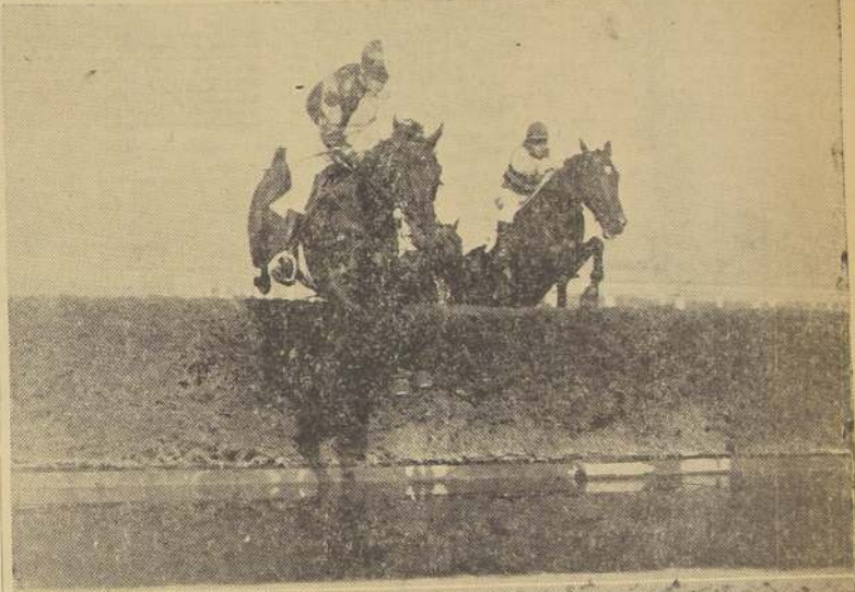
Maule y Vase d'Or, al salvar el salto de agua.

Digno, al rematar penúltimo, probó una vez más, ser una nulidad en canchales de invierno, y desgraciadamente no pudo aglutinar los méritos verdaderos de Rico Moro, debido a las malas que últimamente ha estado a sufrir.