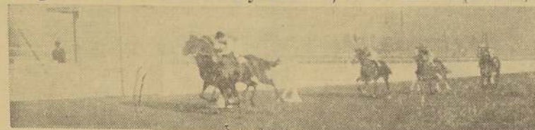
Well Played bate a Gold por 1/2 cabeza. Tercero, Duque de Toledo, y 4.º, Polonesa.

A un tren muy sostenido se cubrieron las primeras distancias, y la prueba no tuvo cambios de importancia hasta la recta de los mil cien metros.