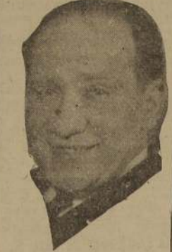
El rotativo, de Variedades revisteriles, y cine que viene ofreciendo la popular sala Balmaceda ha llevado todos estos días