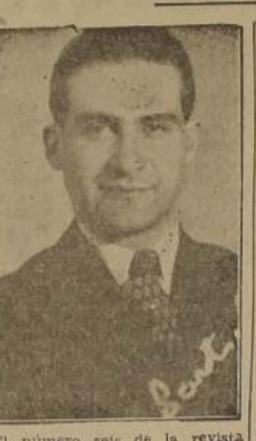
El número seis de la revista "Cinemundo", que dirige el prestigioso crítico y periodista Miguel Munizaga Iribarren, ha alcanzado un franco éxito.

Entre los programas que transmitirá hoy domingo la B. B. C. para sus auditores de Chile, figura una discusión del máximo interés a base del tema "Comencemos a Latino América". Esta audición se radiará a las 21.15 (hora chilena) y puede ser captada por las ondas de 24.92 y 31.55 metros.