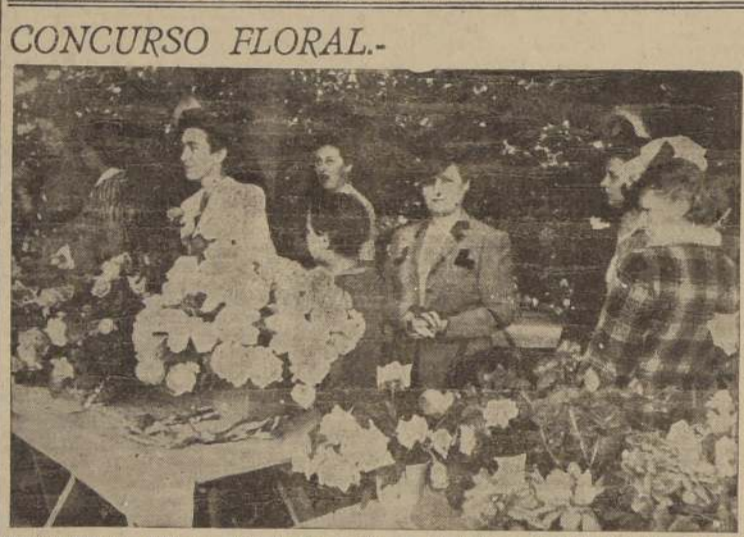
Algunos asistentes al Concurso Floral que se realiza en los Jardines del Stade Français y que ha llamado justamente la atención del público por la belleza y frescura de las flores que allí se exhiben. La exposición estará abierta durante el día de hoy de 10 a 12 horas y también se servirá té y refrescos.