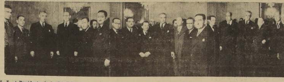
S. E. el Presidente de la República, Excmo. señor Juan Antonio Ríos, acompañado de algunos senadores y diputados de los diversos partidos, durante la recepción de ayer.