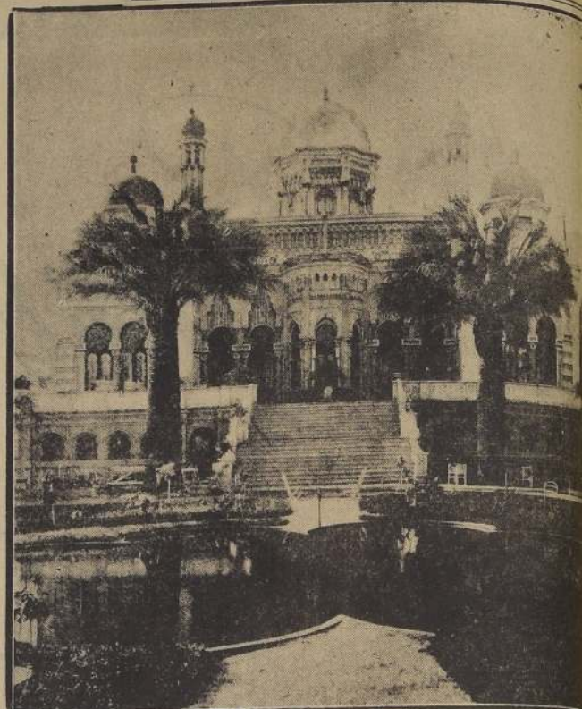
El Palacio Concha-Cazotte

Epoca lejana de una grandiosidad señorial, de ademanes galantes, de distinción sin igual. Treinta o más años han pasado y ya no quedan ni vestigios de esa época. Las viejas costumbres