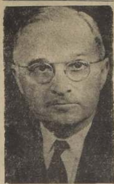
Truman hará mañana una declaración oficial

El personal que se está enviando en las costas occidentales y orientales, figuran muchos de los científicos que se encuentran en la región subcontinental del Polo Sur.