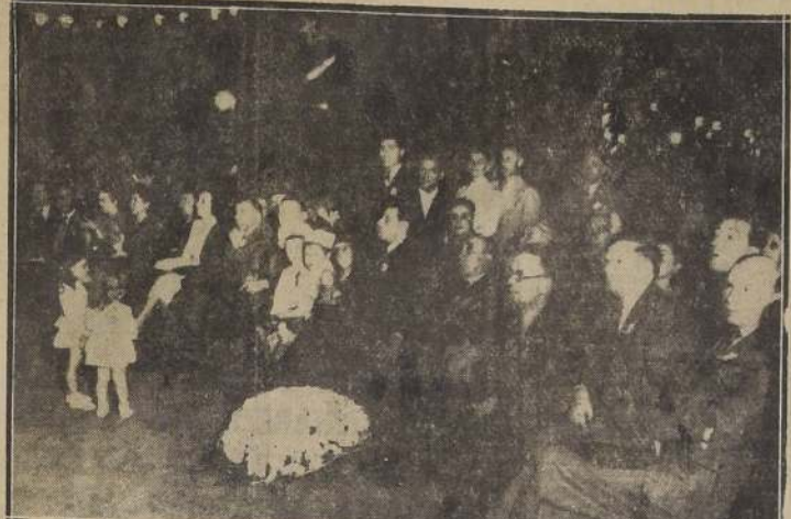
Una parte de la numerosa concurrencia habida anoche en el Parque Forestal, para celebrar el aniversario de la Revolución Soviética. Hubo festival y baile popular.