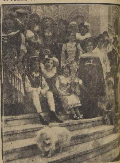
Grupo de asistentes al baile