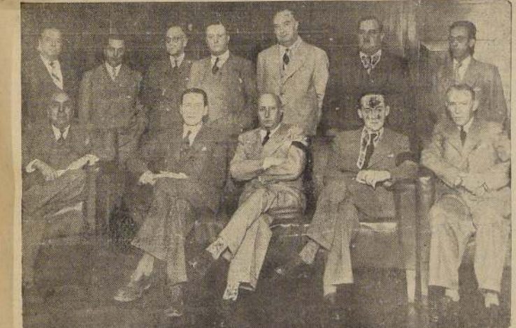
Asistentes al acto de ayer

EN BREVE SE ESTABLECERA EN NUMEROSAS LOCALIDADES DEL PAIS EL SISTEMA DE PEQUEÑOS DEPOSITOS POR CORREOS