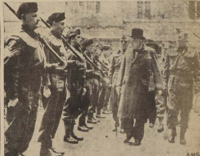
El Primer Ministro de Gran Bretaña, Mr. Winston Churchill en momentos de pasar revista a la guardia real en la custodia del Palacio del Parlamento, que comprende en la misma a diplomatas mensajeros y a otras personas al servicio de las dos cámaras. — Este destacamento carga con la responsabilidad de custodiar todo el palacio.