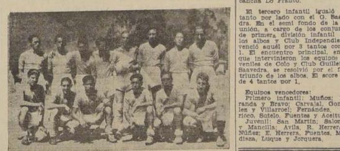
CAMPEON DE ZAPALLAR.— Primer cuadro del Deportivo Zapallar, que se adjudicó el premio "Alfredo Cerda"

En Zapallar se efectuó recientemente un campeonato especial de fútbol, que tuvo como estímulo principal el trofeo "Alfredo Cerda", y que contó con la participación de los conjuntos representativos de los clubes Flecha, de Ligua, Papudo Zapallar, Pullave y Tierras Blancas.