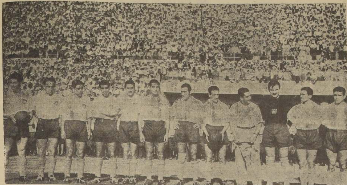
CON EL JUGADOR "NUMERO 12".— Las tribunas y las galerías se vieron siempre atestadas de un público fanático en el Campeonato Sudamericano Extraordinario de Fútbol. Naturalmente, su favorito era el cuadro local que aquí aparece frente a su mejor jugador, el "número doce". En este un factor demasiado influyente para el cronista argentino que hizo este artículo lo titula así: "Setenta mil once contra once"