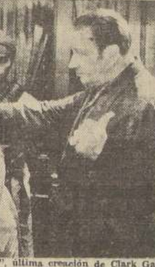
Una escena de "Mares de China", última creación de Clark Gable.

Aparece con Wallace Beery de aventuras, de crimen y misterio y bajo las órdenes de un joven y valiente capitán, surgen los mares del Oriente, asaltado por la cubierta de un barco de lujo que hace su carrera entre Hong Kong y Singapur. Con un argumento de ilusiones.