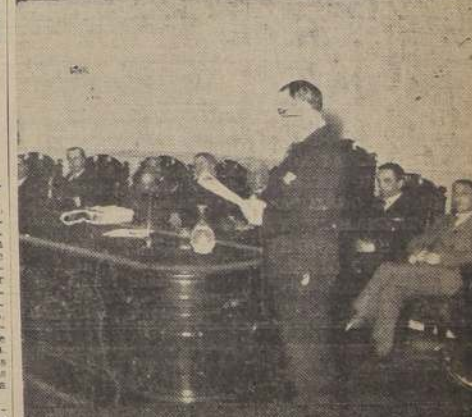
El Ministro del Uruguay, durante su discurso