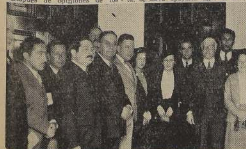
Durante la visita a la Intendencia.