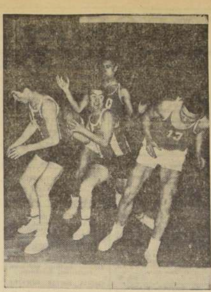
Con buen basket y con mucha efectividad en los lanzamientos al cesto, Palestino doblegó ayer a Escuela Normal, por 83 a 74.

En el decimosexto match, Universidad Técnica no encontró mayores problemas para derrotar a Ferroviarios, 72 por 58. Montenegro y Lamis serán los protagonistas al plantel metropolitano que enfrentará a la selección de Japón. Jugador de color, de Costa Rica que mide dos metros tendrá Palestino este año.