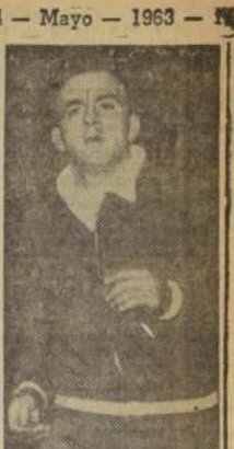
UN AÑO MAS vestirá Di Stefano la tricota de Real Madrid.

MOSCÚ, 23 (UPI). — El equipo de fútbol brasileño "Fluminense" iniciará su gira por la Unión Soviética el seis de junio próximo, según se anunció hoy.