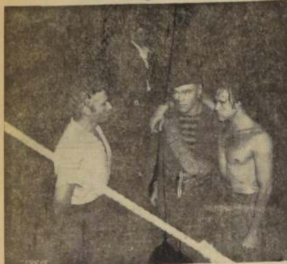
Scott Brady y Jeff Chandler, en una escena de la fascinante película Universal que se exhibe en el City con gran éxito: "BUCANEROS DEL CARIBE", con censura menores y de un impresionante colorido. Ondea aquí la negra bandera de los filibusteros que asolaban los siete mares.