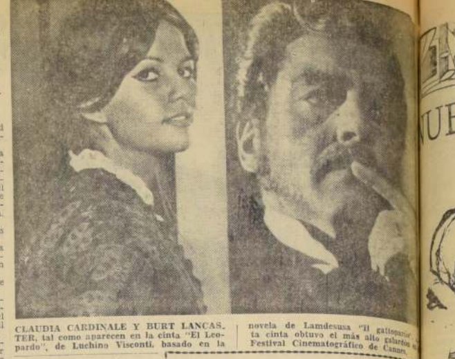
CLAUDIA CARDINALE Y BURT LANCAS. TER, tal como aparecen en la cinta "El Leopardo", de Luchino Visconti, basado en la novela de Lamdusa "Il gattopardo". La cinta obtuvo el más alto galardón del Festival Cinematográfico de Cannes.

NOVA, Huérfanos 837 (30176).— El mundo es mi casa. La guerra de espías. El diablo nunca duerme.