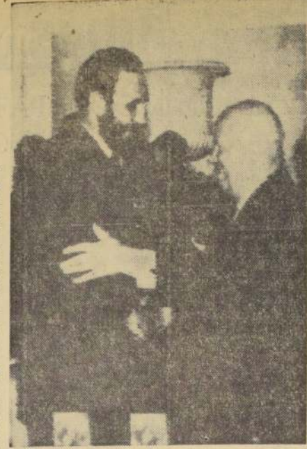
MOSCÚ.— Fidel Castro y Nikita Khrushchev sellan la amistad cubano-soviética con un estrecho abrazo. Momentos antes habían suscrito una declaración conjunta.

Castro habló también, durante 50 minutos, y dijo que la Unión Soviética no había violado "en ningún momento" una gran guerra para defender a un país pequeño.