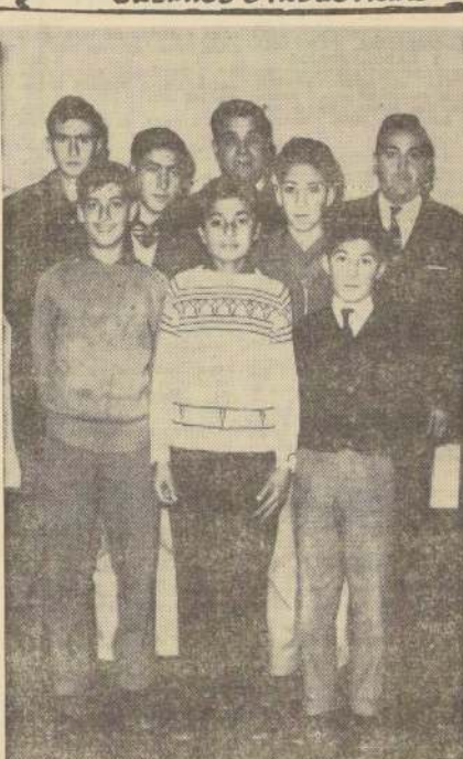
BABY-FUTBOL INFANTIL. — Organizado por la Junta de Vecinos de la Población Vivaceta, hoy jueves 23 de mayo se dará comienzo a un Campeonato Especial de Baby-Fútbol destinado a difundir la práctica de este hermoso deporte entre los niños de ese populoso sector. Este certamen proseguirá desarrollándose los días martes, jueves y sábados, de 19 horas adelante, dividido en dos series, una, la "A", en que actuarán las penecas de 1 metro a 1 metro 40 centímetros de estatura y la otra, la "B", para los niños cuya estatura fluctúe entre 1 metro 40 y 1 metro 60. Las edades mínimas y máximas para ambas series serán de 8 a 15 años, respectivamente. Al cierre de inscripciones, el sábado pasado, 42 equipos habían ratificado su anotación. En el grabado, un grupo de jugadores y dirigentes organizadores de este novedoso torneo. De izquierda a derecha, primera fila: Nicolás Jadue, José Duarte y Ricardo Parra, "planyeros" de la Serie "A"; segunda fila: Nelson Guzmán y Vicente Peña, jugadores de la Serie "B"; y, atrás, Luis Destefani, Flaminio Contreras y Manuel Jiménez, dirigentes. El certamen será por doble eliminación, debiendo los 8 equipos finalistas definir su colocación por puntos, 4 en cada serie. En caso de empate en las dobles eliminaciones, se tirarán tres penales por lado.

Dep. Administración Qta. Normal tiene flamante directiva