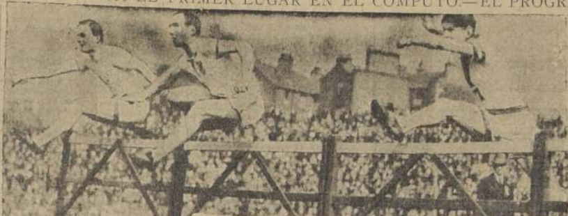
Lord Burghley (el del centro), es aclamado por 25,000 personas, al vencer en el reciente torneo de Stamford Bridge en los 400 metros vallas, la misma prueba que ayer le dió un hermoso triunfo en Amsterdam.

EN EL DESARROLLO DE LOS 100 METROS PARA DAMAS, SE BATE EN DOS SERIES EL RECORD MUNDIAL.—ESTADOS UNIDOS CONSERVA EL PRIMER LUGAR EN EL COMPUTO.—EL PROGRAMA DE HOY