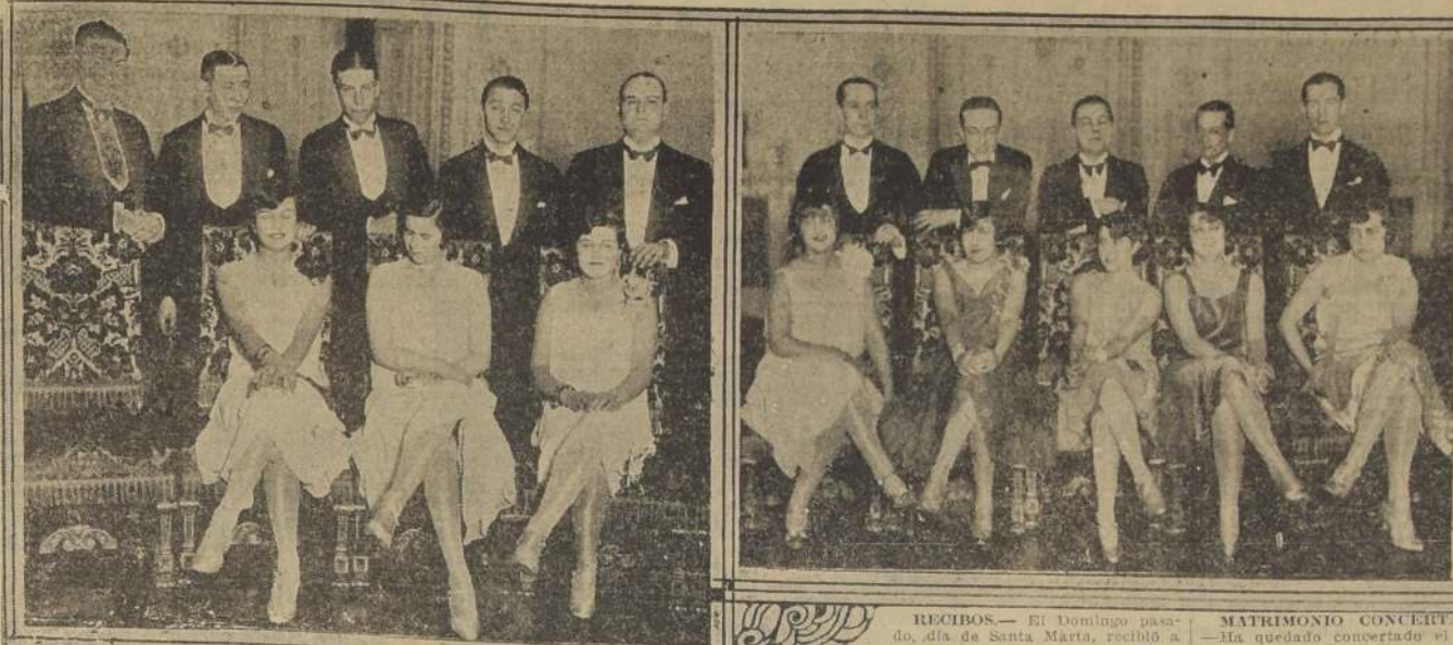
Durante el dinner-dance del Club de la Unión

NO RIAMOS DE LAS DE- BILIDADES HUMANAS; DEBEMOS LAS MAS BIEN HACER CORRER NUE- STRAS LAGRIMAS. — DE- MOCRATES.