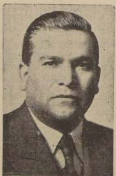
Dr. Florencio Durán Bernalde

Esta tarde a las 19.30 horas, en el local de la Asamblea Radical de San- tiago, Teatino 360, tendrá lugar la conferencia sobre legislación sindi- cal dictada el Presidente del Senado, doctor Florencio Durán Bernalde. A esta charla que se le atribuye trascendencia importante por el contenido de su temario, asistirán miembros del Consejo Ejecutivo del Partido Radical, parlamentarios de distintas provincias, representantes de entidades gremiales de empleados públicos y particulares y ex alumnos congruentes. Con la conferencia que dictará el doctor Durán, quedará inaugurado un ciclo de charlas sobre política social se efectuarán periódicamente en la Asamblea Radical de Santiago.