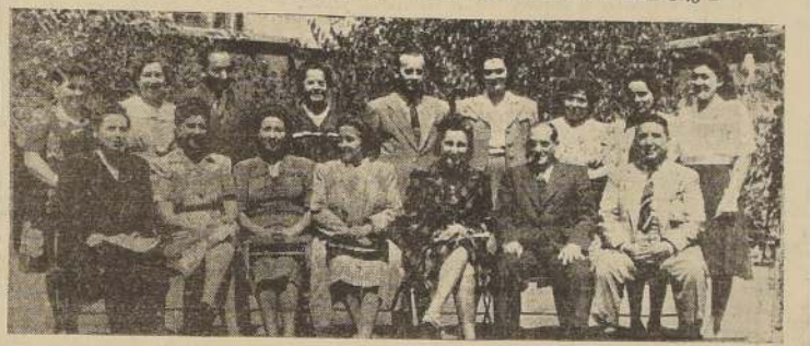
El directorio del Centro de Padres de la Escuela "Panamá"

AL INICIARSE EL PERIODO ESCOLAR DE ESTE PRESTIGIOSO ESTABLECIMIENTO QUE FUNCIONA ANEXO A LA NORMAL N.º 1