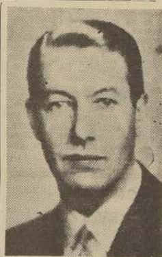
Don Benjamin Claro Velasco, Ministro de Educacion.

El año que recién se inicia nos ofrece a todos: autoridades, profesores y alumnos, la oportunidad de cultivar tan nobles sentimientos, aportando cada uno su cuota de buena voluntad para que la vida escolar se desenvuelva en forma cordial, justa y democrática.