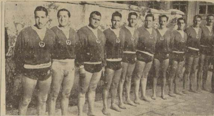
Campeón de Chile. — Equipo de waterpolo de la Unión Española, de Santiago, que ayer venció al Playa Ancha, de Valparaíso, por dos goles a uno.

EN EL MATCH DECISIVO, JUGADO AYER EN LA PISCINA DEL EST. MILITAR, VENCIO AL DEPORTIVO PLAYA ANCHA, DE VALPARAISO, POR 2 A 1