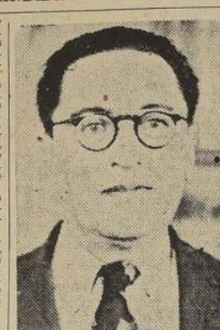
Secretario General del Partido Comunista, señor Carlos Con- treras Labarca