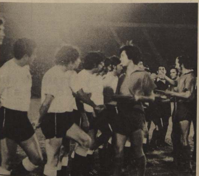
Los jugadores de Calera entregan al plantel albo un recuerdo por el título obtenido, que es la decimaprimera estrella. Un gesto cordial y significativo.