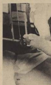
Todo empezó con un volador. La luz y el ruido de los fuegos artificiales provocó la curiosidad de los niños, quienes se acercaron a verlos.

De esta forma, la comunidad universitaria festejó a sus hijos una bulliciosa fiesta que sólo fue interrumpida por la presencia de Sergio Onofre Jarpa, quien llegó frente a la Universidad en un show publicitario a la hora de los escudos entregados.