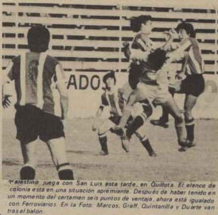
Palestino juega con San Luis esta tarde, en Quillota. El elenco de colonia está en una situación apremiante. Después de haber tenido en un momento del certamen seis puntos de ventaja, ahora está igualado con Ferrovianos. En la Foto: Marcos, Graff, Quintanilla y Duarte van tras el balón.

Objetivamente, la confrontación Nublense-Ferrovianos se presenta como favorable al tercero en discordia, Palestino. Y el resultado es importantísimo por las consideraciones hechas anteriormente.