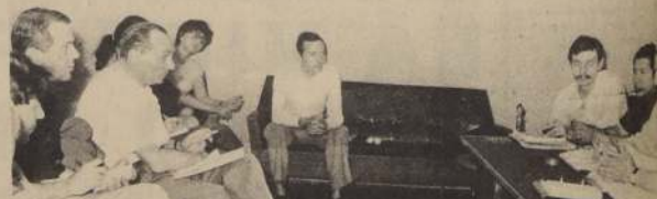
UN GRUPO de profesionales italianos —periodistas, abogados y catedráticos— dialogaron ayer con los máximos dirigentes de la CUT, sobre organización sindical chilena y el proceso revolucionario que vive nuestro país. El grupo está integrado por Giacomini

La nueva directiva se constituyó el mismo 17 de diciembre a las 16 horas, ceremonia que consta en la Hoja N° 80 del Libro de Actas de la organización vecinal y firmada por todos los directores elegidos.