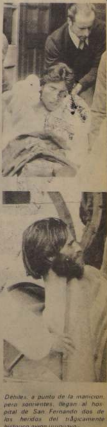
Débiles, a punto de la manicomio, pero sonrientes, llegan al hospital de San Fernando dos de los heridos del trágico accidente: el avión uruguayo.

Como se recordará, el avión uruguayo con 45 personas a bordo, repartidas en 40 pasajeros y cinco tripulantes, se estrelló el 13 de octubre pasado cuando viajaba a Chile con los integrantes del equipo de rugby Old Christians de Montevideo, y algunos familiares.