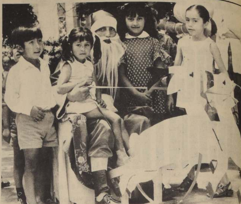
EL VIEJO PASCUERO vuelve en estos días a ser el personaje más importante para los niños. El es confiado y amigable. Recibe los pedidos más insólitos, que después los padres deben satisfacer.