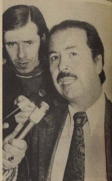
Ministro de Educación Jorge Tapia