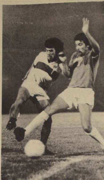
Católica y su juventud se desinfló al final del torneo. Una goleada de proporciones ante Green Cross, en la despedida.