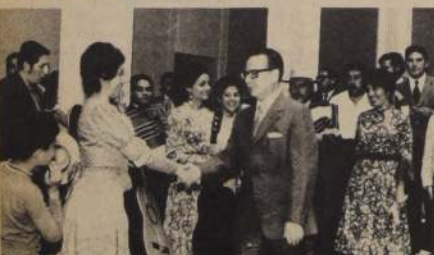
UNA ALEGRE reunión de fin de año se realizó ayer en la Moneda, donde estuvo presente el Jefe del Estado. Fue una fiesta de los empleados de las diversas reparticiones, que quisieron celebrar con anticipación las fiestas navideñas.

Secretario de Estado, que habían concurrido para saludar al Comandante en Jefe del Ejército, y Ministro del Interior, con motivo de las próximas festividades de Pascua y Año Nuevo.