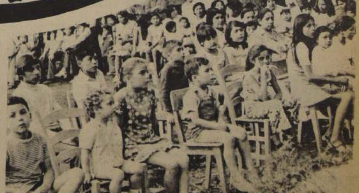
Fiesta de los hijos de los trabajadores de Cachantun, celebrando la Navidad en la Planta de Coinco.