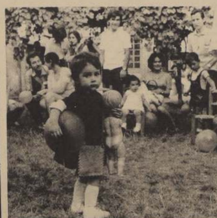
PADRES e hijos tuvieron una tarde de alegría en la fiesta navideña de la Universidad Técnica.

No beba cuando tenga que manejar. El alcohol pone en peligro su vida y la de los demás.