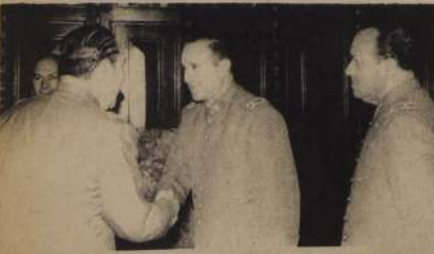
MIEMBROS del Cuerpo de Generales del Ejército concurrieron ayer a saludar al Ministro del Interior, General Carlos Prats González, con motivo de las fiestas de fin de año.