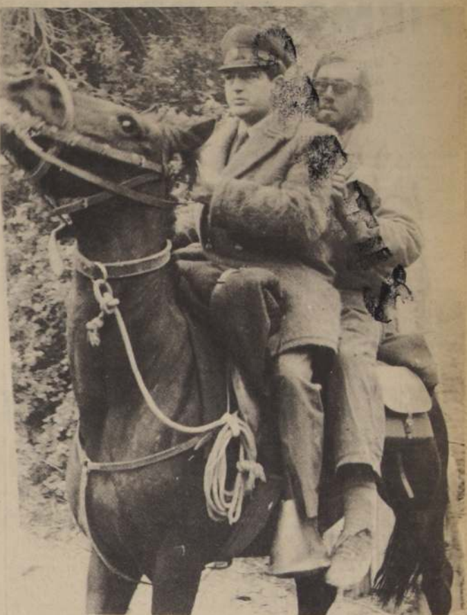
CARABINEROS demostró nuevamente su capacidad y su valor en las difíciles tareas de rescate de los sobrevivientes. Vemos aquí a uno de los que participaron en el salvamento, lle-

Tal como se preveía, al regresar al helipuerto preparado en el Regimiento Colchagua, e intentar volver a la cordillera, los helicópteros no pudieron hacerlo porque el viento había aumentado, razón por la cual regresaron al regimiento para