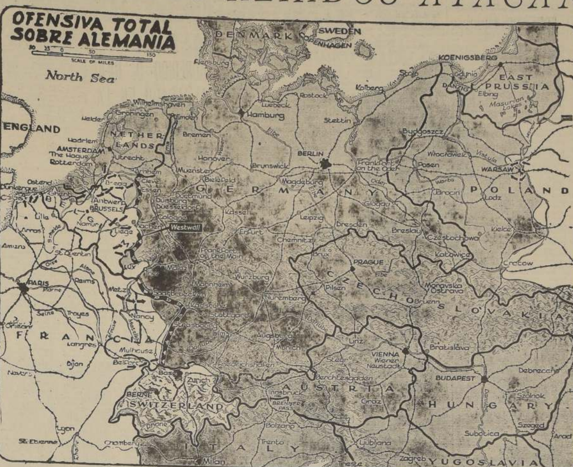
Ocho ejércitos aliados están atacando la "Fortaleza Interior" de Alemania desde Holanda hasta Belfort. Según informaciones no confirmadas, los alemanes proyectaban abandonar la amagada Línea Siegfried, a fin de acortar sus líneas y organizar la defensa detrás del Rin. La nueva ofensiva combinada que han iniciado los aliados en Holanda tiene por objeto flanquear por el norte las fortificaciones de la Línea Siegfried. Flanqueadas las fortificaciones del Rin, el territorio alemán quedará abierto a los ejércitos acorazados anglo-americanos.