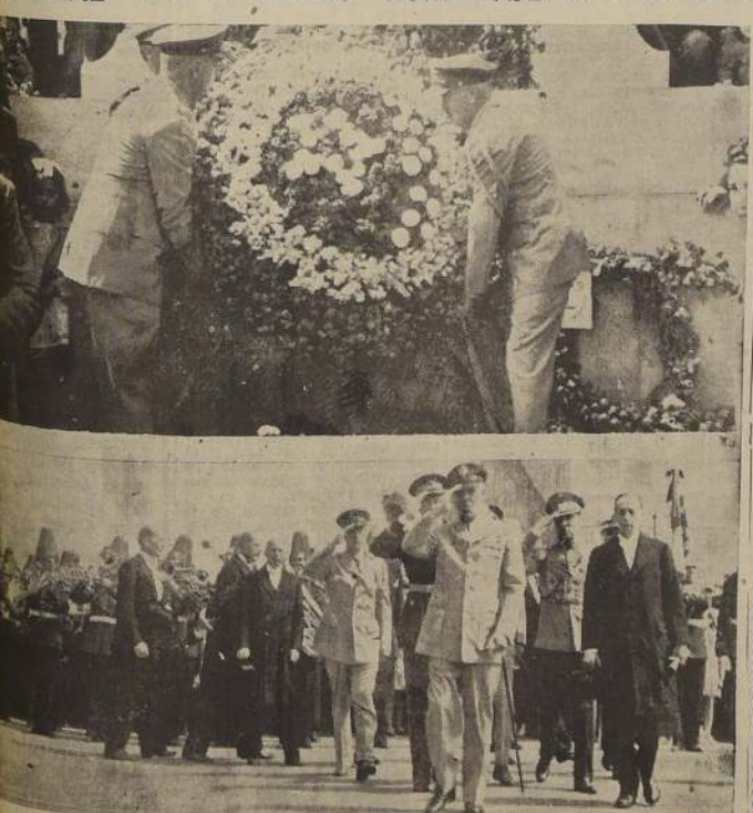
General Brett y comitiva oficial de la Delegación Militar Norteamericana colocan una guirnalda floral en la estatua de O'Higgins. — El Embajador Bowers y jefes militares de Estados Unidos llegando al monumento

GENERAL BRETT RINDIO HOMENAJE A O'HIGGINS