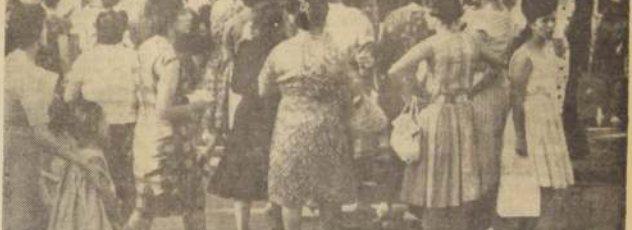
El amplio recinto del Stade Francais se hizo estrecho para recibir a más de 25 mil mujeres, que acudieron a expresar su decisión de elegir a Julio Durán como Presidente de Chile. En el grabado, se puede apreciar a las numerosas mujeres que no pudieron ingresar al Stade, y que esperan con paciencia que se amplíen las acomodaciones para estar presentes en la proclamación.

Terminó rindiendo un emocionante homenaje a la mujer chilena, recordando que ella ya ha decidido el destino de Chile, con su inimitable corazón y su fervoroso patriotismo, al encaminarse decididamente por la ruta de la democracia.