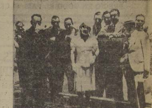
Nini Marshall en el momento de su llegada a Los Cerrillos.

Gracioso público esperaba ayer en Los Cerrillos a Nini Marshall (Catita), que llegó en el avión de la Condor, a las 13.15 horas. Aunque la hora no era muy apropiada todo el público que alcanzó a saber su llegada, preguntando al Teatro Balmaceda y las oficinas de la Condor, hizo a la querida y popular artista una manifestación del cariño que siente por ella. Catita retribuyó los saludos de periodistas y público en general, manifestándose feliz de llegar a Santiago, y con muchos deseos de debutar ante este público de quien ella tiene magníficas recuerdos. Venía con ella el conocido galán argentino de cine Pedro Quartucci, quien también dijo estaba feliz de volver a Chile, cuando vino al Santiago con la Compañía de Revistas Ivo Pelay. Hoy Nini Marshall se presenta en la amplia sala del Splendid en las funciones de tarde y noche, en combinación con cine, y las pocas entradas disponibles se encuentran en venta.