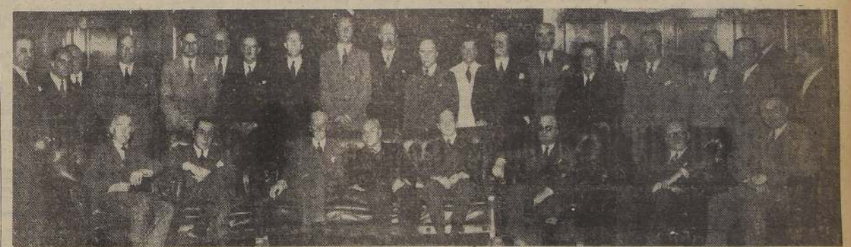
Asistentes al almuerzo ofrecido por el Consejo del Banco Central en honor de la Misión Británica

EN LA MAÑANA, LOS TECNICOS SOSTUVIERON UNA LARGA ENTREVISTA CON EL MINISTRO DE FOMENTO. — ALMUERZO EN EL BANCO CENTRAL