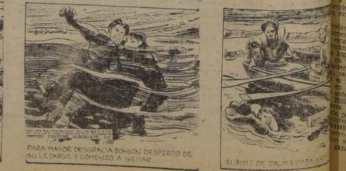
ESTORBADO POR EL MONO Y LAS CADENAS, TARZAN DIFÍCILMENTE PODIA MANTENERSE A FLOTE. PARA MAYOR DESGRACIA BONGOU DESPERTO DE SU LETARGO Y COMENZO A GRITAR. EL BOTE DE ZALIM ESTABA...