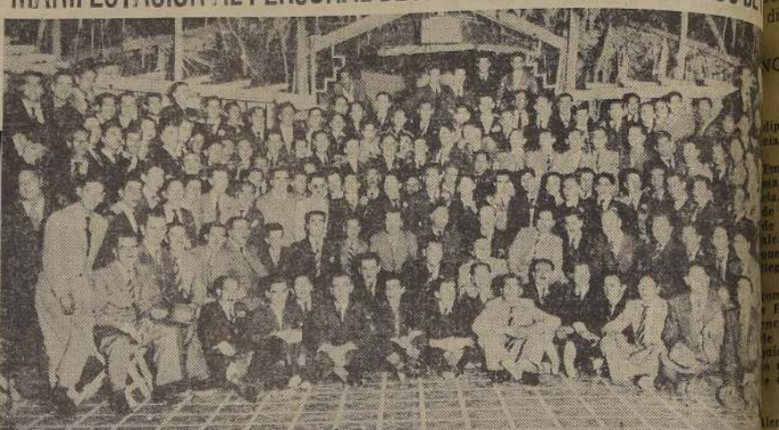
Asistentes a la brillante manifestación ofrecida por la Gerencia de la Sociedad Productos de Papel en honor de los empleados y obreros, como un acto de reconocimiento de la firma a la cooperación de sus obreros colaboradores durante el pasado. — La reunión se desarrolló en la Quinta Valparaíso, en un ambiente de general cordialidad.