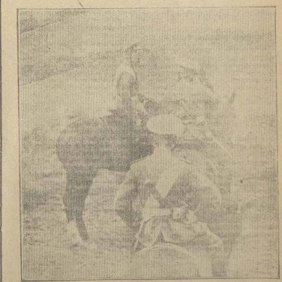
El Czar de Rusia en un campamento militar recibiendo, por intermedio de un oficial de alta graduación, un mensaje del Estado Mayor

Es una fuente monumental en que el arte francés ha agrupado con su delicadeza y gracia habituales, alegorías a las artes y las industrias.