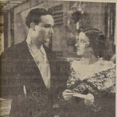
Estrellita Castro y El Niño de Utrera, principales intérpretes de la película española "Rosario la Cortijera", que estrena hoy el Teatro Coliseo.

ROSARIO, LA CORTIJERA", FILM ESPAÑOL EXHIBE HOY EL COLISEO