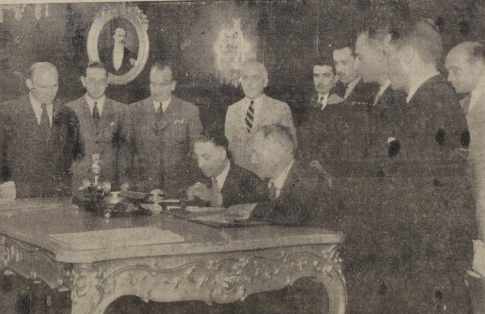
El Ministro de Relaciones Exteriores y Comercio, don José Ramón Gutiérrez, y el Ministro de Francia, Conde Louis de Sartiges, en el momento en que ayer pusieron su firma a las actas de canje de las ratificaciones del Convenio Comercial entre ambos países. La ceremonia se efectuó en el salón rojo de la Cancillería, en presencia de altos funcionarios del Gobierno y de la Legación de Francia.

El Departamento de Estado confirmó que se llevará a efecto el vuelo a Buenos Aires de los aviones de bombardeo.