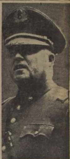
GENERAL DANÚS PEÑA Intendente