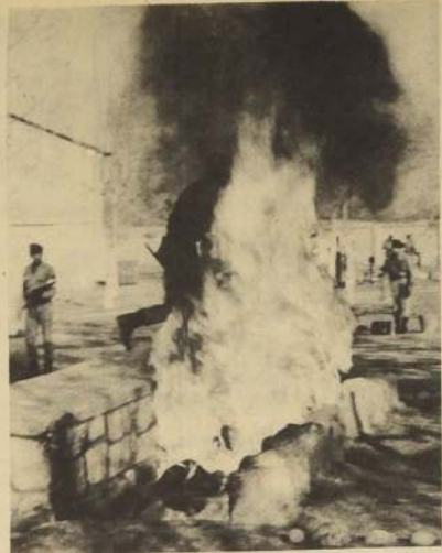
Un infante cruza el foso en llamas; una de las pruebas que se exige a quienes pasan por la Escuela de Infantería.

El propósito principal del Proyecto enviado por el Ejecutivo, se centra en establecer disposiciones que fijen, en forma eficaz, como renta máxima, el 11 por ciento del avalúo de la propiedad. Esta disposición establecida desde 1954, en la ley 11.622, no está siendo aplicada actualmente debido a su procedimiento, y a que los arrendatarios están poco protegidos por los organismos oficiales.