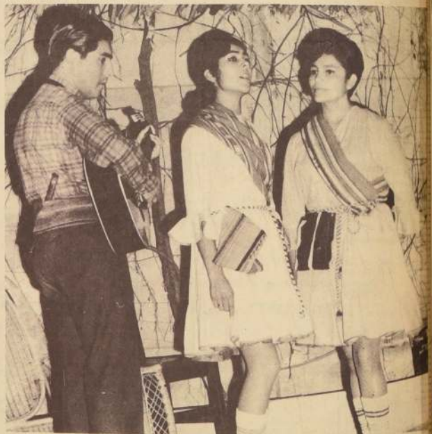
Tres integrantes del Conjunto Folklórico de la Universidad del Norte.