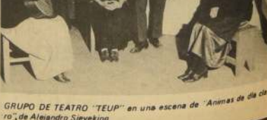
GRUPO DE TEATRO "TEUP" en una escena de "Animas de día claro" de Alejandro Sieveking.

Han realizado varias giras al sur, llegando hasta la Isla de Chiloé. Los gastos de viaje deben ser costeados por ellos mismos. Afortunadamente, la Unión de Profesores está estudiando un item para el TEUP.