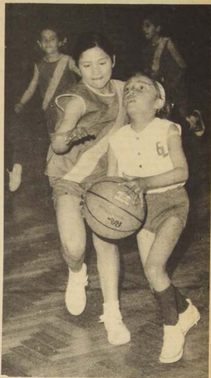
DOS ACTITUDES pero ambas con un solo objetivo, hacer algo en favor de su equipo. El minibásquetbol revolucionó a las pequeñas del país.

La Asociación Santiago logró sus propósitos y las niñas le pagaron mucho más allá de lo esperado. Fue una grata y fructífera Competencia, que debe continuarse siempre y no sólo frente a la Moneda, también en los barrios y centros habitacionales en los que, sin duda, también hay cientos de niñas que desearían competir.