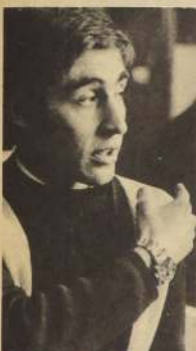
"LA EXPERIENCIA anterior me servirá para este Campeonato en Alemania"

—"La verdad es que mucha gente no ha ayudado a superar los problemas comunes en todo este tipo de "aventuras". Por una parte, está LAN-CHILE, que