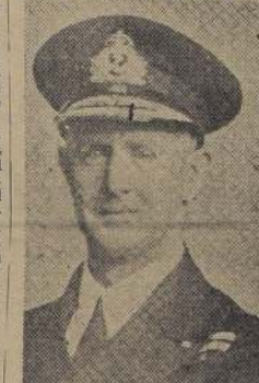
Almirante Cunningham, comandante en jefe de la flota aliada en el Mediterráneo

Sobre la costa del Atlántico de Marruecos, se efectuaron desembarcos en todos los puntos pre-