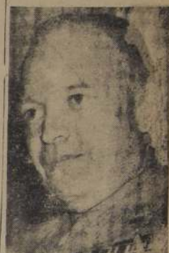
General Eisenhower, comandante de los ejércitos aliados en Africa Septentrional Francesa

LAS BAJAS ALIADAS SON ESCASAS. Un portavoz del cuartel general de las fuerzas aliadas expresó (PASA A LA PAG. 7)