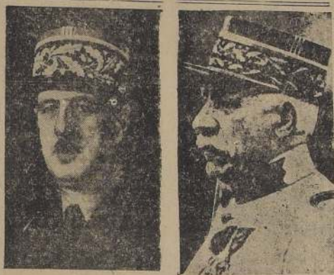
General Henri Giraud

El Africa Occidental Francesa está alerta para repeler una posible invasión y siguiendo las instrucciones del mariscal Petain, el Gobernador General Rolon informó desde Dakar