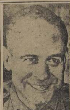
General Doolittle, jefe de las fuerzas aéreas aliadas que operan en Marruecos, Argelia y Túnez

Según se ha informado aquí, Vichy, fue el general Koeltz, comandante del XI Cuerpo de Ejército, y no el general Juin, quien firmó el acta de armisticio con el mayor general Ryder, norteamericano. Según el acuerdo, continúan en funciones las autoridades civiles y M. Emmanuel Temple, prefecto de Argel, actúa como gobernador general interino. La bandera francesa sigue flameando sobre la sede de la jefatura naval local y el