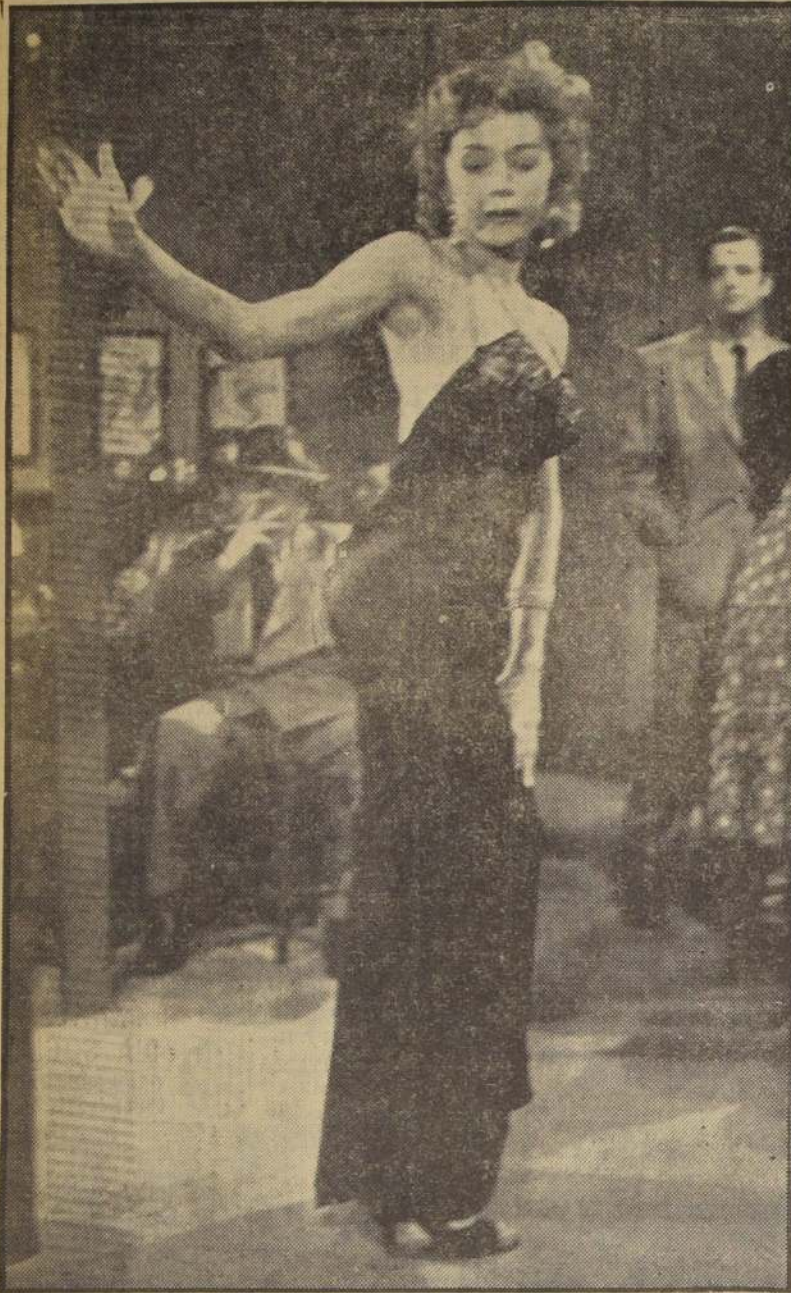
Gloria Graham, curvilínea estrella de la Universal Pictures, aparece en la fotografía ejecutando un candente baile en el rodaje de su última película: "La última coartada". Gloria baila y canta la picaresca estrofa: "Mis galanes, sean rendidos admiradores o amantes exigentes, siempre me pegan...". La escena se desarrolla en el interior de un cafetín, donde Gloria distrae a la concurrencia con sus ondulantes interpretaciones. ¿Será Ud., lector, capaz de pegarle a Gloria?