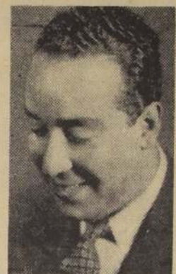
Diputado por Santiago, don Humberto Pinto Díaz, quien formuló ayer graves cargos contra el Consejo Nacional de Comercio Exterior.

El diputado Pinto Díaz denunció que el CONDECOR, organismo que depende del Ministerio de Economía, ha autorizado la importación de maquinaria suntuaria y hasta la importación de puros y cigarrillos. Pinto Díaz denunció que el CONDECOR, organismo que depende del Ministerio de Economía, ha autorizado la importación de maquinaria suntuaria y hasta la importación de puros y cigarrillos.