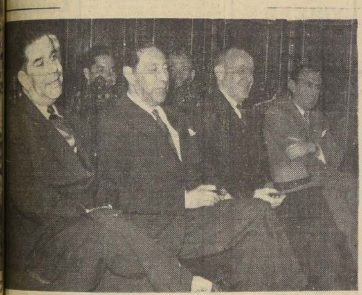
En la noche de ayer, en el despacho del ministro del Interior, don Arturo Olavarria, se inició la reunión a que este invitó a los representantes de los partidos políticos con representación parlamentaria.

Se firmó el decreto que designa Comisión de Enajenamiento de Papel