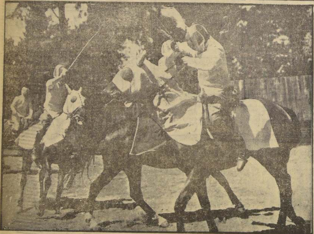
En Johannesburg (Africa del Sur) ha sido resucitado con gran éxito el viejo deporte de esgrima a caballo. Los encuentros se realizan en equipos de tres y con el sable como arma, resultando vencedor el que logra cortar la pluma que llevan en la cabeza, adherida a la máscara, cada uno de los contrin-

cantes. En buenas cuentas, vuelven los tiempos del Rey Arturo y los caballeros de la Mesa Redonda, con torneos y competencias como el que aparece en la fotografía. El viejo deporte ha sido resucitado por el Club denominado "Los Centauros" en Johannesburg.