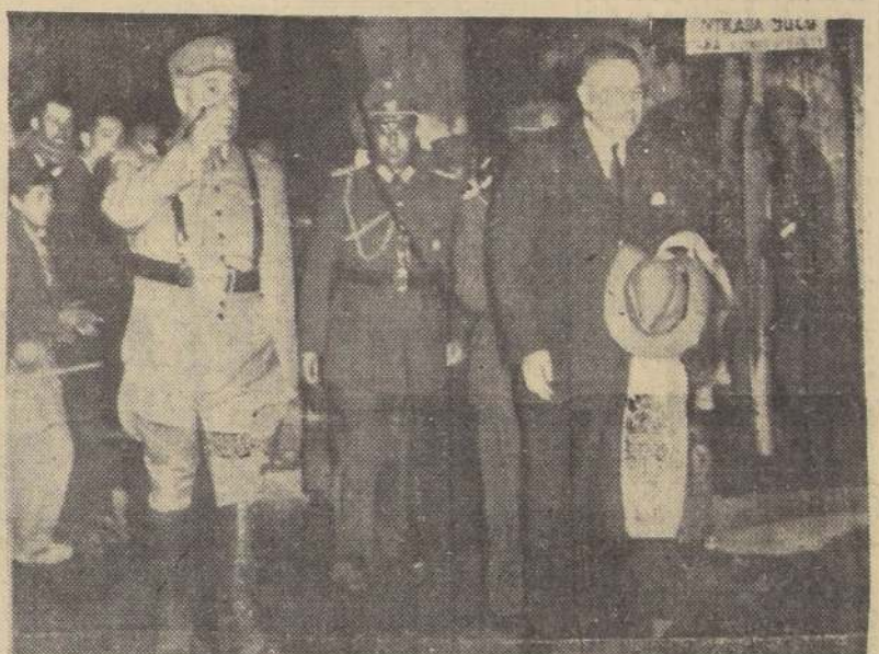
EN EL CAMPAMENTO DE LA ESCUELA MILITAR. — Con asistencia del Presidente de la República y señora Graciela Letelier de Ibáñez, de altas autoridades civiles y militares y de numeroso público, la Escuela Militar efectuó anoche la Gran Retreta en su campamento de campaña de la Hacienda "San Manuel", en Melipilla. La «motividad del acto, el patriotismo que inflamó los corazones al conjuro mágico del dulce nombre de la Patria, el candor glorioso de la enseña tricolor y los acordes marciales de la banda de guerra, impulsaron al público a saludar con nutridos aplausos el paso de los bizarros cadetes y de los subalternos. El grabado, muestra al Excmo. señor Balmes llegando al campamento acompañado del Director de la Escuela Militar, general don Ramón Salinas y de su Edecán Militar, teniente coronel don Raúl Florentino.

LIMA, 14 (UP). — Con el pago de la multa por valor de 3.000.000 de dólares y la partida de los cinco balleneros de la flota de Onassis, que fueron apresados por la Armada peruana, quedó definitivamente terminado un conflicto que durante varios días ocupó las primeras páginas de los periódicos, hizo funcionar el cable y mantuvo al público en intensa expectación. Una hora después de abonada la multa, las naves comenzaron a aprovisionarse y embarcaron treinta toneladas de víveres por un valor de más de trescientos mil dólares y solicitaron el permiso de zarpe que fue inmediatamente otorgado. El buque Factoría, Olimpio Challenger y los cuatro balleneros partieron rumbo al sur a las ocho y cincuenta de la noche. En la Antártida se reunirá el resto de la flota ballenera que se refugió en Balboa después de ser perseguida por la Armada peruana.